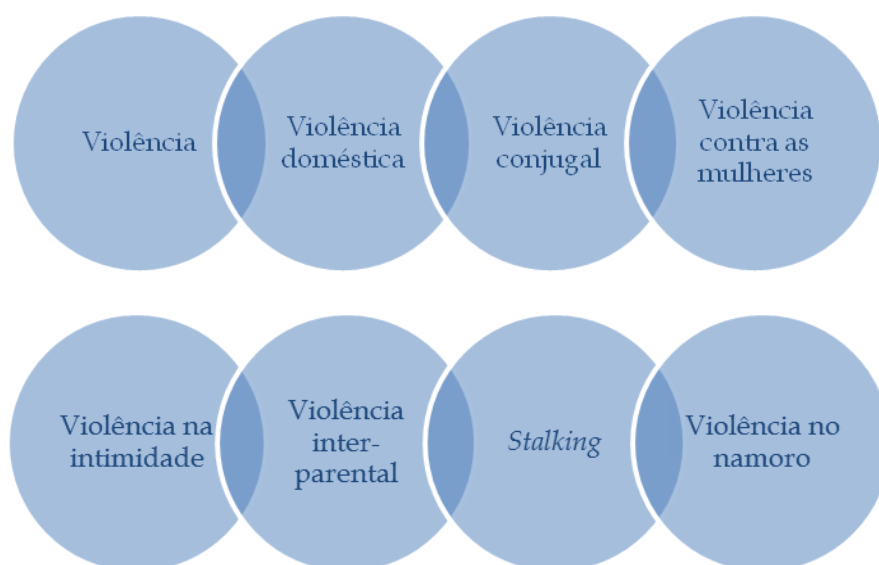
Figura 1. Violências (adaptado apresentação Faro & Sani, 2012)

No que se refere à violência doméstica, a definição não é uniforme, nem consensual. Segundo Pagelow (1984) não há critérios objetivos que permitam aos especialistas um entendimento comum sobre o problema.