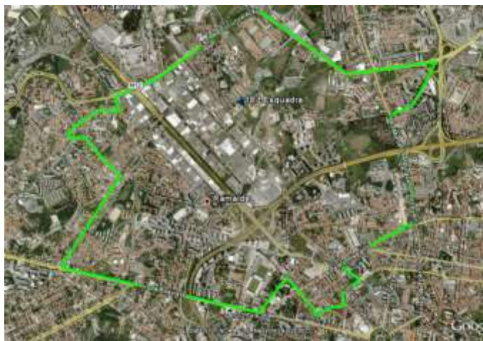
Imagem nº 1- Área abrangida pela 18ª Esquadra da PSP- Viso

A 18.ª Esquadra situa-se na Rua Central do Viso, Torre 1, R/C – Porto e abrange a Freguesia de Ramalde, que conta com uma área de 5,8 Km 2 , confinada a Sul pela freguesia de Lordelo do Ouro, a Norte pelo Concelho de Matosinhos, a Oeste pela freguesia de Aldoar e a Este pelas freguesias de Paranhos e Cedofeita e conta com uma população de 38.012 pessoas, de acordo com os Censos de 2011 (Polícia de Segurança Pública, Artigo facultado em ficheiro Word acerca do funcionamento e hierarquização da PSP).