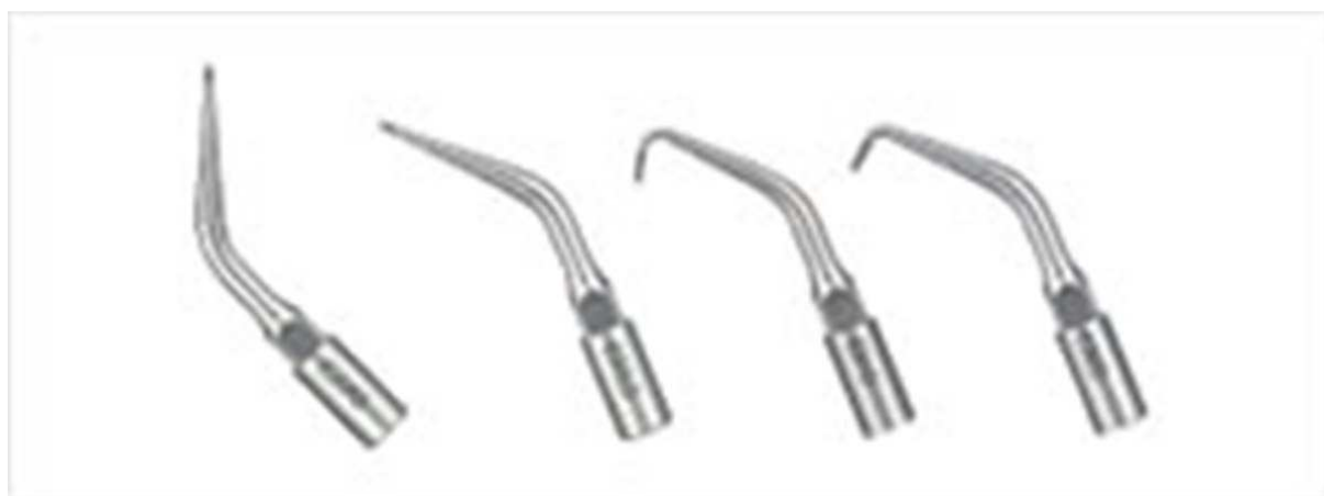
Figura 4- Pontas activas para aparelho ultrassónico.