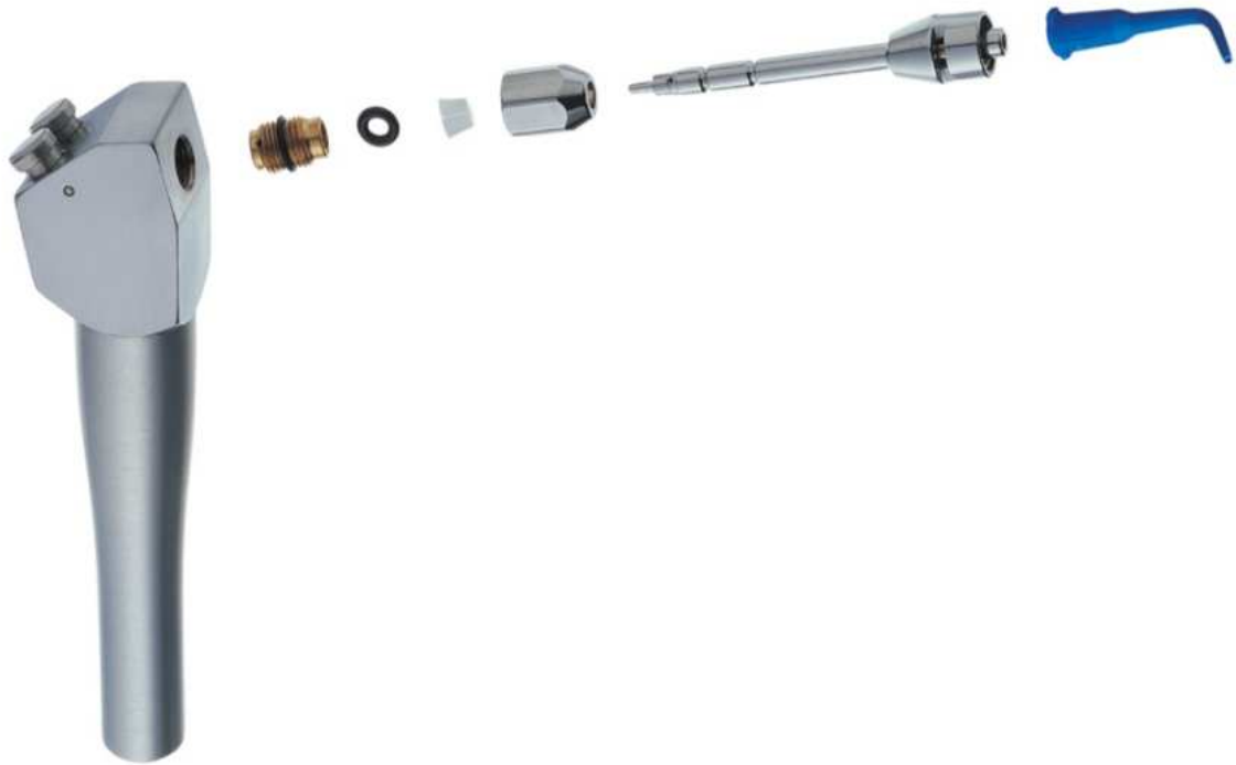
Figura 5- Aparelho Stropko.