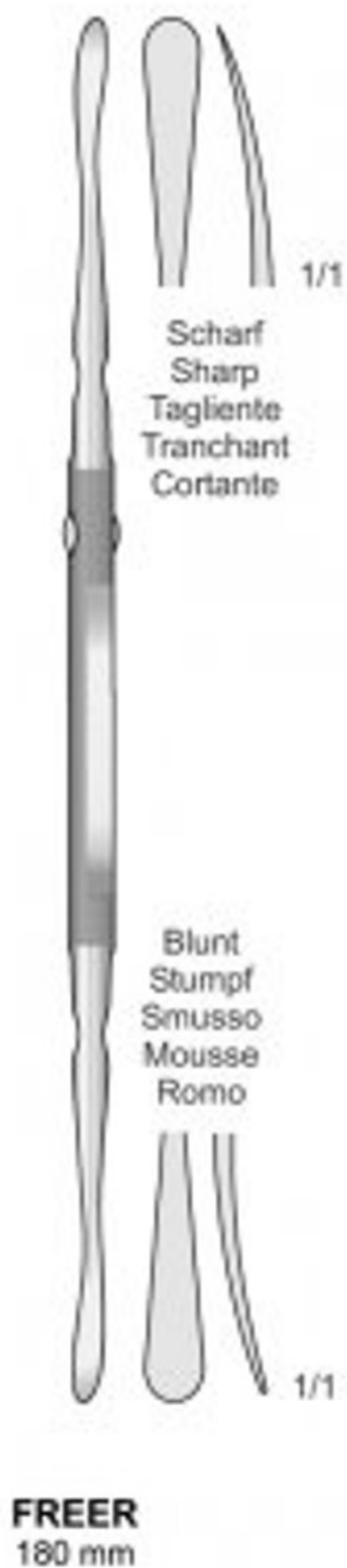
Figura 1- Perióstomo de Freer.