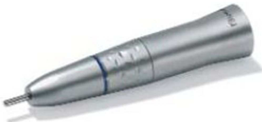
Figura 3- Peça de mão usada na técnica tradicional da preparação da raiz.