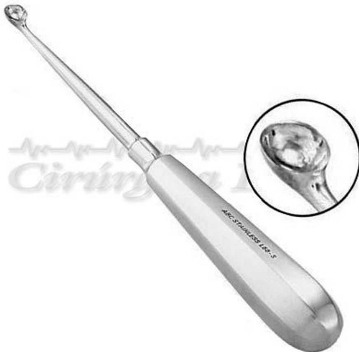
Figura 2- Cureta com o bordo em forma rombóide.