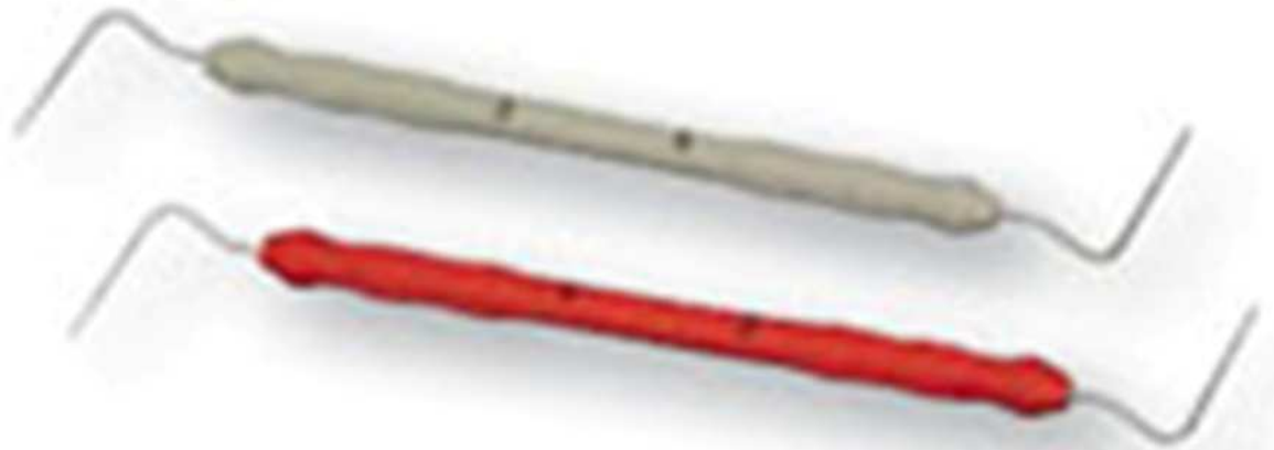
Figura 7- Pluggers Machtou da Maillefer.