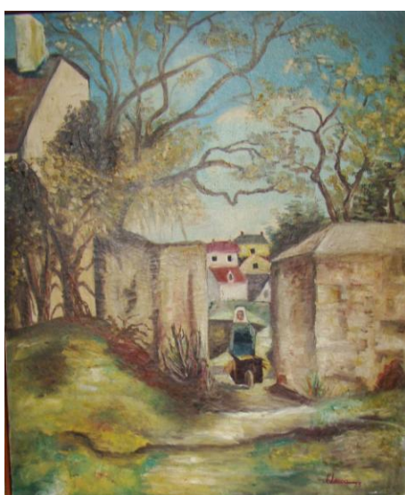
Figura 2 – Freira com Carrinho de Feno , 1972, óleo sobre tela, 55cm x 66cm