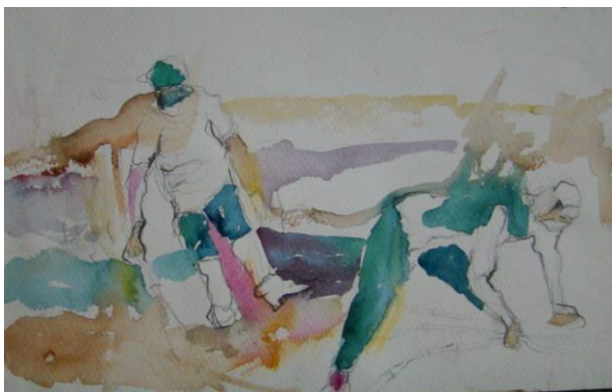
Figura 17 – Hora Extra , 2009, técnica mista sobre cartão, 25cm x 37,5cm