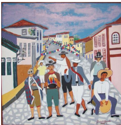
Figura 13 – Os Ritmistas de Olinda , 2001, acrílica sobre tela, 30cm x 40cm