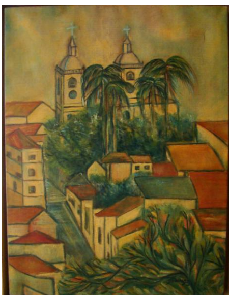
Figura 9 – Matriz N. Sra. Mãe dos Homens , 1994, óleo sobre linho, 30cm x 40cm