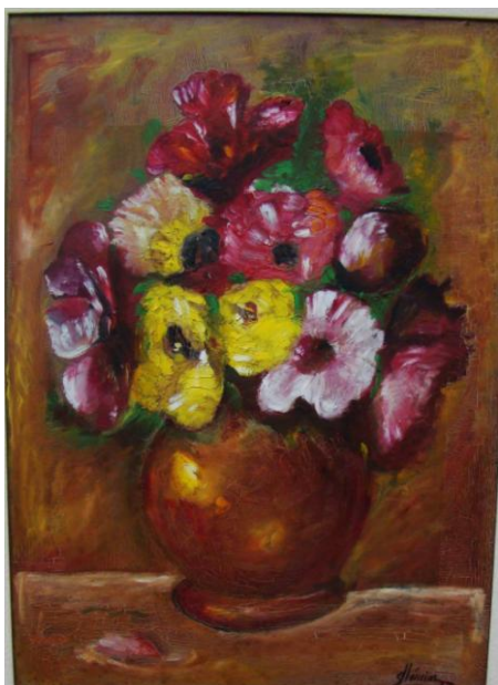
Figura 4 – Papoulas de Papel Crepom , 1977, óleo sobre eucatex, 39cm x 54cm