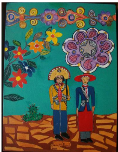
Figura 12 – Figurantes Lendários , 2000, acrílica sobre tela, 30cm x 40cm