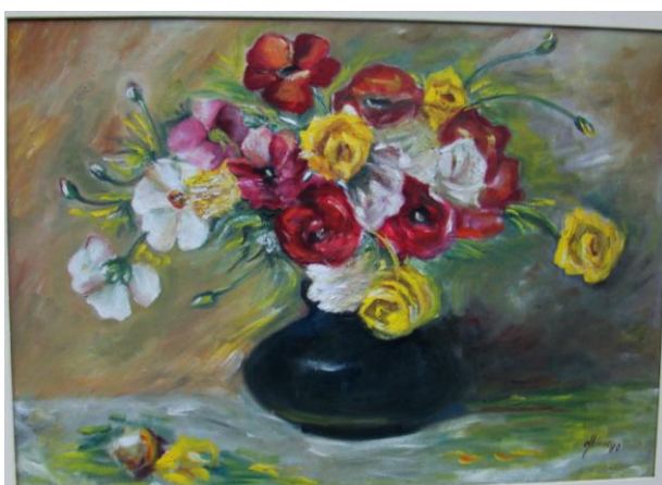
Figura 5 – Vaso Negro , 1980, óleo sobre tela, 51cm x 72cm