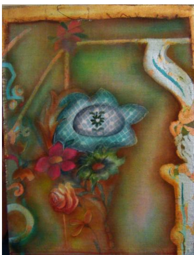
Figura 14 – Tonalidade Sonora , 2009, colagem e óleo sobre linho, 30cm x 40cm