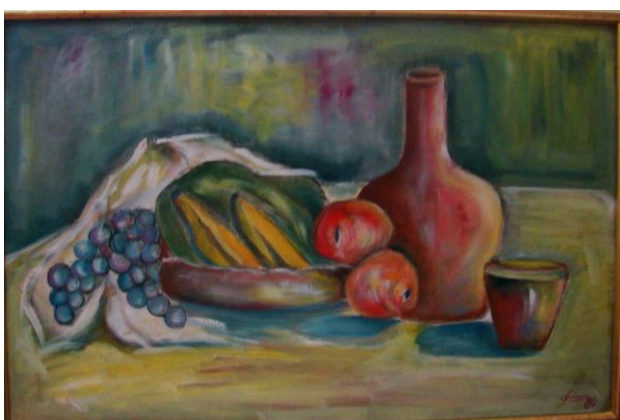
Figura 6 – À Mesa , 1980, óleo sobre tela, 62cm x 73cm