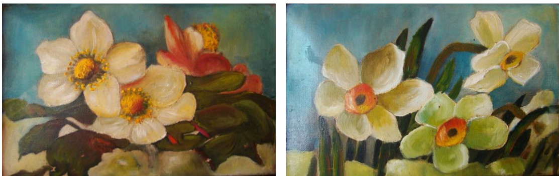
Figura 1 – Camélias I e II , 1921, óleo sobre tela, 16cm x 26cm Autora: Philomena Prisco