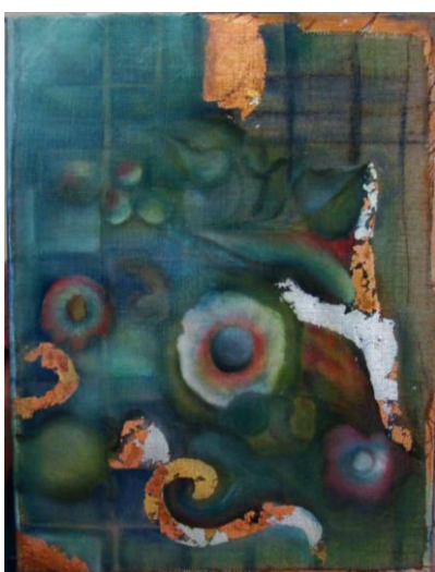
Figura 15 – Bordaduras de Acordes , 2008, colagem e óleo sobre linho, 30cm x 40cm