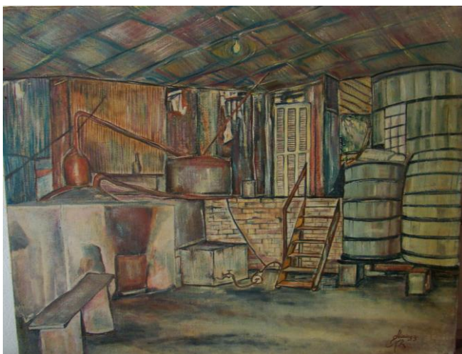
Figura 8 – Alambique , 1993, óleo sobre tela, 44cm x 50cm