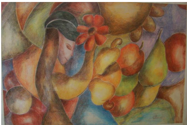
Figura 7 – Perfil entre Flores e Frutas , 1987, creiom sobre cartão, 30cm x 44cm