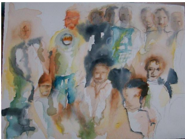
Figura 16 – Em Reunião , 2008, técnica mista sobre cartão, 30cm x 39,5cm