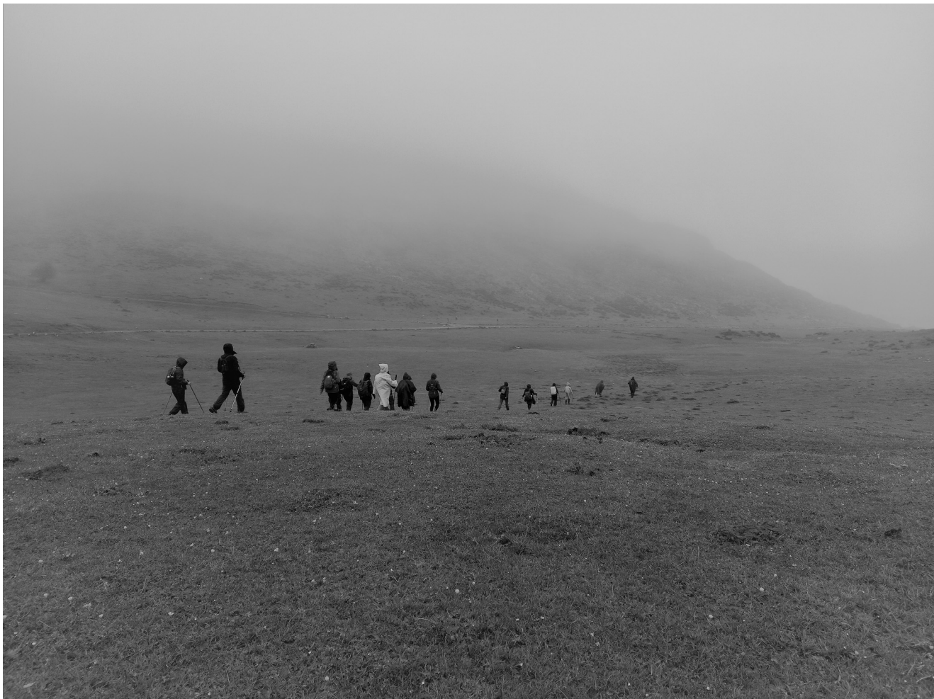
Imagem 1 – «Trekking» no Parque Nacional dos Picos da Europa em direção aos Lagos de Covadonga, Astúrias, Espanha. Fonte: Arquivo pessoal (fotografia de 03/06/2021).

eu e mais dois amigos dedicamos subir ao Kala Patthar, que é a irmã, a irmã pequenina do Everest. Foi o que me marcou mais pela dificuldade. Tava muito cansada. Não conseguia respirar. E quando eu lá cheguei, vi um nascer do sol, tipo brutal. Eh pá, aconteça o que acontecer, eu nunca vou esquecer aquele nascer do sol, nem o que me passou pela cabeça ao subir aquilo. Aquelas duas horas de subida foram horríveis. Fisicamente, foi o limite, tava no limite. Tive que tomar Diamox para conseguir dilatar as vias respiratórias. Foi mesmo no limite. Não queria desistir. Eu via tanta gente a desistir. Eu não queria desistir. Eh pá, quando eu cheguei lá, tipo brutal. Não sei explicar, eu não sou uma pessoa de chorar, de andar sempre com a lagriminha fácil. Mas eu cheguei lá. Eh pá, estava no pranto, ver me a chorar, tipo super emocionada, muito agradecida. Agradecida por tá ali, por ter conseguido subir até o fim. Eh pá, e tava muito cansada, tava exausta. Tava mesmo. De não conseguir respirar. Os meus músculos não tinham oxigênio, tava mesmo nas últimas. E depois chego lá, eh pá, foi tipo incrível, um pico de energia incrível. E foi ali uma mistura de cansaço. Eh pá e também foi uma experiência muito espiritual, foi muito. Há ali qualquer coisas maiores que nós próprios. Eh pá, foi o «trekking» mais difícil. (Informante 2).