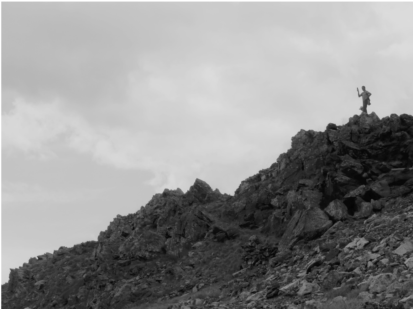
Imagem 5 – «Trekker» registrando uma fotografia no Vale de Sorteny, Pireneus, Andorra.