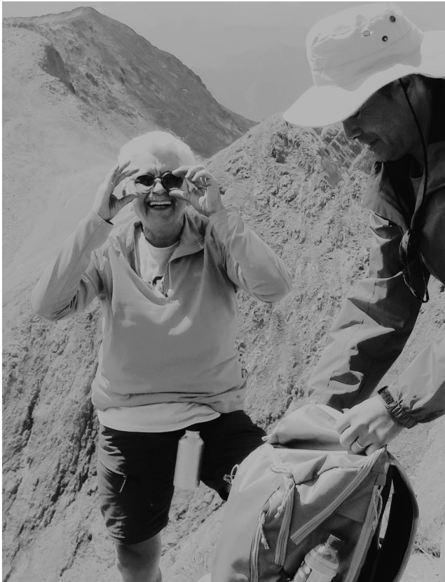
Imagem 3 – «Trekker» no exato momento de chegada ao Pico de Comapedrosa, Pireneus, Andorra. Fonte: Arquivo pessoal (fotografia de 21/08/2021).