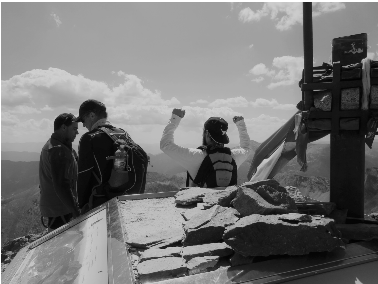
Imagem 2 – «Trekker» no exato momento de chegada ao Pico de Comapedrosa, Pireneus, Andorra.

Fonte: Arquivo pessoal (fotografia de 21/08/2021).