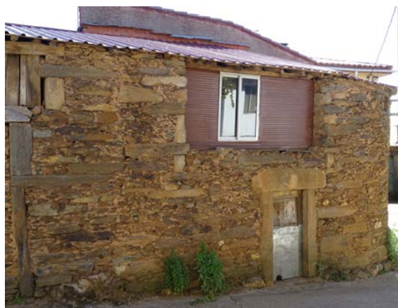
Figura 11. La incorporación de lo actual sobre lo histórico en Nuez de Aliste (Zamora, España).

primacial de realização da dignidade da pessoa humana, objecto de direitos fundamentais, meio ao serviço da democratização da cultura e esteio da independência e da identidade nacionais”. Si se imposibilita el libre desarrollo del vernáculo actual, ¿se permitirá esa “transmissão de uma herança nacional cuja continuidade e enriquecimento unirá as gerações num percurso civilizacional singular”? ¿No se estará privando a las generaciones venideras del testimonio cultural auténtico de nuestro tiempo?