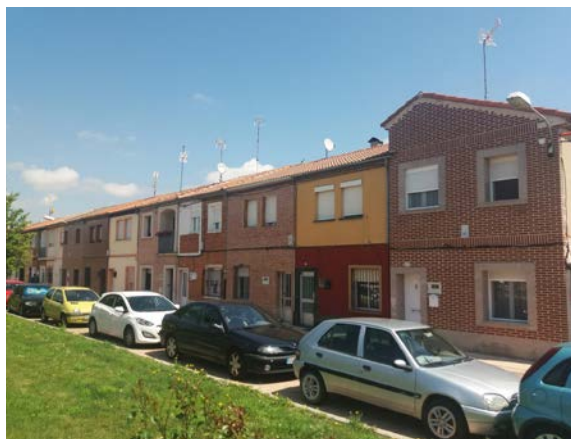
Figura 6. Barrio de San Pedro (Valladolid, España). Medio siglo después de la construcción de esta promoción de casas sociales, cada familia ha transformado la suya a su manera, hasta hacer casi imperceptible la uniformidad original.

Cualquier arquitectura, pues, refleja valores de la comunidad que la usa o interpreta. Lo cual, no obstante, no quiere decir que suceda en todos los casos con la misma intensidad. Como dije, lo vernáculo se mostrará en distinto grado en función de la importancia que, en cada uno de los factores, adquiera el carácter exógeno.