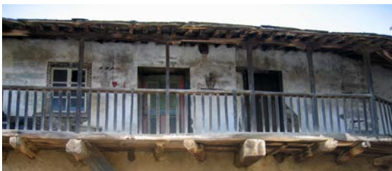
Figura 7. Corredor en una casa de Rabal (Trás-os-Montes, Portugal) con pinturas decorativas y bendiciones apotropaicas que caracterizan la arquitectura como vivienda.

En efecto, aunque a priori cualquier investigador de la arquitectura popular dará por hecho que sus estudios incluyen el agente humano, lo cierto es que muy pocos lo tratan con una mínima profundidad más allá de la acción constructiva (Roigè, Estrada y Beltrán, 1997; Pérez Gil, 2019). Apenas se presta atención a los usuarios de esa arquitectura; a los primigenios o a las generaciones que les sucedieron hasta nuestros días. Su estudio se delega en otras disciplinas –como la Antropología–, las cuales, a su vez, tampoco han venido demostrando el interés debido por la arquitectura. Falla así una transversalidad que debiera estar en la base de este conocimiento disciplinario. Y, sin embargo de dicha displicencia por el agente humano, abundan por doquier las citas de compromiso a la “comunidad”, las “gentes” o los “autores anónimos”. Son citas huecas que, de por sí, no hacen sino omitir a los verdaderos protagonistas del artefacto cultural, que son o fueron individuos concretos, con nombres y apellidos. Como señala Kirshenblatt-Gimblett (2004), esos términos genéricos connotan un medio pasivo, carente de voluntad, intención o subjetividad. Las personas quedan entonces fuera de la ecuación cultural y, sin ellas, no hay cultura.