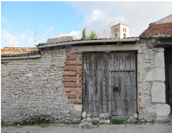
Figura 5. Cuéllar (Segovia, España). Fábrica histórica con distintos aparejos (mampostería, adobe) y su reciente reparación con otro igualmente distinto (ladrillo). La innovación se enmarca en la tradición del proceso, y su aplicación constructiva no difiere esencialmente de la anterior.

pues también nos hablarán de las soluciones constructivas de ese grupo humano, de su técnica tradicional, de su relación con el medio, etcétera, ya sea en el plano histórico o en el actual. Pero aun cuando esos materiales sean de tipo industrial e importados, su presencia no tiene por qué erradicar los significados culturales de la arquitectura, pues se aplican según unos criterios locales, en la medida y forma que cubren unas necesidades y expectativas propias y específicas del lugar.