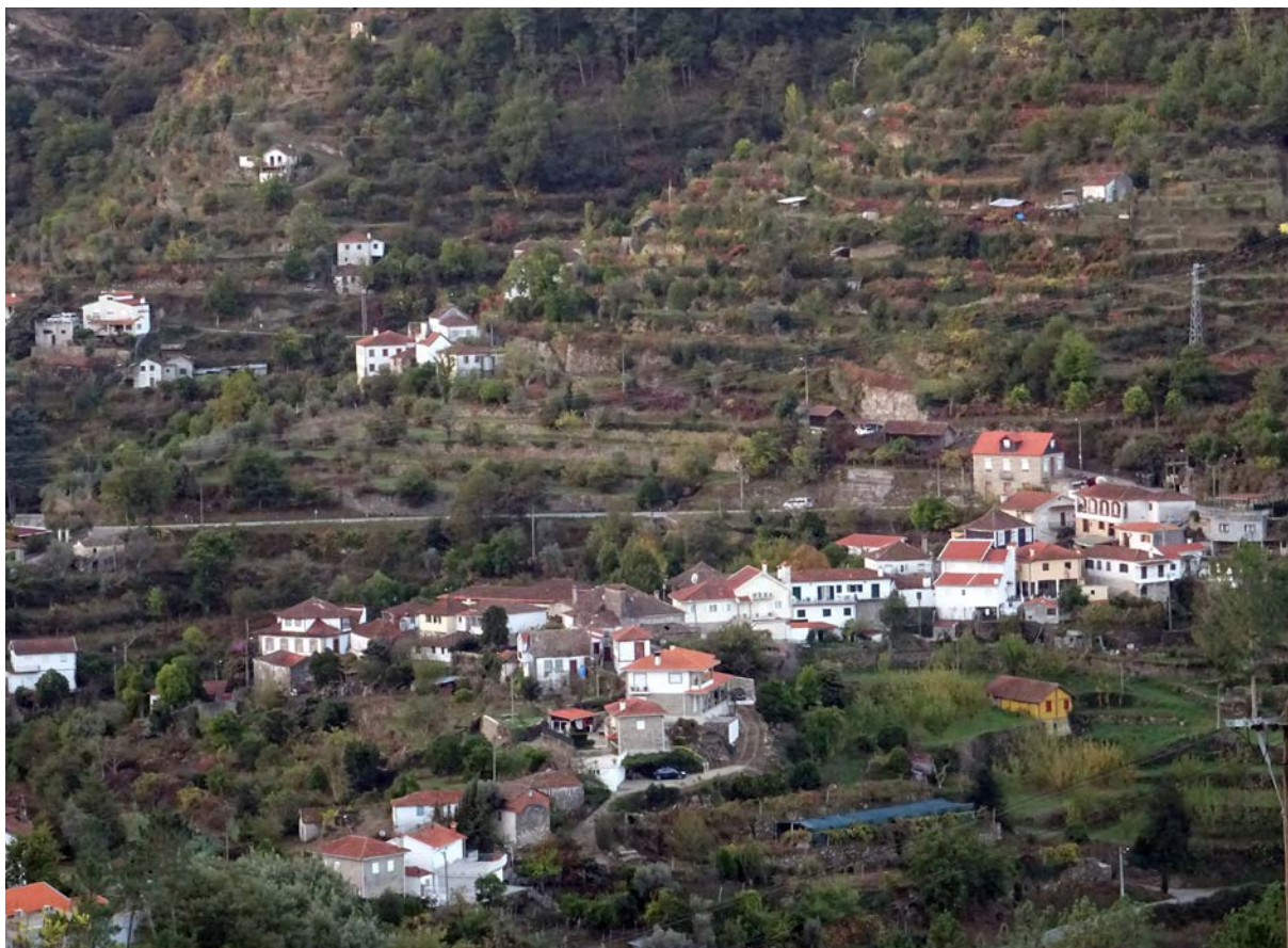
Figura 13. Para entender integralmente y en clave cultural el paisaje de la ribera del Bestança (Cinfães, Portugal) hay que leer e interpretar todos los factores que lo constituyen: naturales y humanos, materiales e intangibles, históricos y actuales. Así, la adaptación topográfica de las aldeas y caserío, las relaciones con el río, las nuevas infraestructuras y comunicaciones, las terrazas históricas, los abandonos, las aportaciones de los retornados...