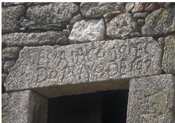
Figura 8. Dintel en una casa de Montesinho (Trás-os-Montes, Portugal). Las arquitecturas ni son anónimas ni atemporales.

Podríamos poner innumerables ejemplos relativos a estas transformaciones, y muchos chocarían frontalmente con la percepción que tenemos de sus respectivas imágenes “auténticas”, las que se han institucionalizado a partir del último vernáculo histórico. Así, los historiadores de la Arquitectura Agustín Bustamante y Fernando Marías, al estudiar las Relaciones de Felipe II (1575–1578) en el área de Toledo, llegaron a la conclusión de que el uso de ladrillo y teja podía ser excepcional incluso en lugares donde se producían. A pesar de la imagen que hoy tenemos de su arquitectura tradicional, la mayoría de viviendas rurales de esa zona eran entonces miserables construcciones de tapial de una sola planta y cubierta vegetal. Seguían unos modelos que, como afirman estos autores, hoy tan sólo podríamos reconocer en construcciones como “chozas y bombos, estructuras completamente cerradas y de miserable ventilación y, lógicamente, carentes de patio, una de las características más señaladas de la habitación urbana y de lo que hoy consideramos arquitectura popular de los pueblos castellanos” (Bustamante and Marías, 1990). Y en el mismo sentido, aunque de manera más gráfica y elocuente, podemos echar un ojo a las fotografías históricas de Artur Pastor para comprobar cómo aun a mediados del siglo pasado eran muy comunes las cubiertas vegetales de colmo en las aldeas de Trás-os-Montes, aunque poco después se generalizase la teja árabe y, más recientemente, otras industriales.