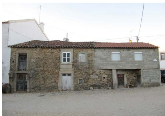
Figura 4. Expresión del vernáculo actual con materiales industriales y su integración en lo histórico. Caçarelhos [Trás-os-Montes, Portugal].

En efecto, el abuelo de ese joven se decantó por la piedra sesenta años atrás, pero ¿por qué? ¿No fue acaso porque la piedra, además de satisfacer sus necesidades, era el material más eficiente y económico que tenía a su disposición? Si le hubiesen dado la oportunidad de emplear aparejos industriales, igualmente eficientes pero ya labrados y mucho más económicos, ¿no los habría utilizado? A pesar de la diferencia de material ¿realmente difieren en lo cultural ese abuelo que no tenía ni televisión y este otro nieto suyo que se conecta a un mundo global a través del teléfono que lleva en su bolsillo? ¿O quizás el nieto sigue reproduciendo los mismos esquemas culturales en los que se ha educado [eficiencia, austeridad, prevalencia del pragmatismo sobre la estética...]?