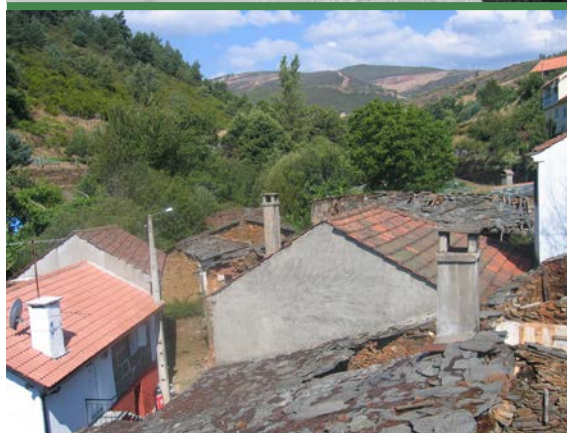
Figuras 9 y 10. Trás-os-Montes (Portugal), construcciones con cubierta vegetal en la década de 1950 (Arquivo Municipal de Lisboa, Coleção Artur Pastor, PT-AMLSB-ART-010965). Portelo (Trás-os-Montes, Portugal). Nuevos tejados de teja conviviendo con otros antiguos de pizarra. Antes hubo vegetales. Fotografía del autor.

Si hemos perdido la memoria de las fases anteriores del vernáculo histórico, habremos de hablar de amnesia, desconocimiento o falta de investigación. Pero en ningún caso de atemporalidad, con la acepción de estatismo que conlleva ese término. A este respecto, la citada Carta del Património Vernáculo construído nuevamente parece que vuelve a confirmar nuestro discurso al reconocer lo vernáculo como un proceso cultural en continuo cambio y adaptación: