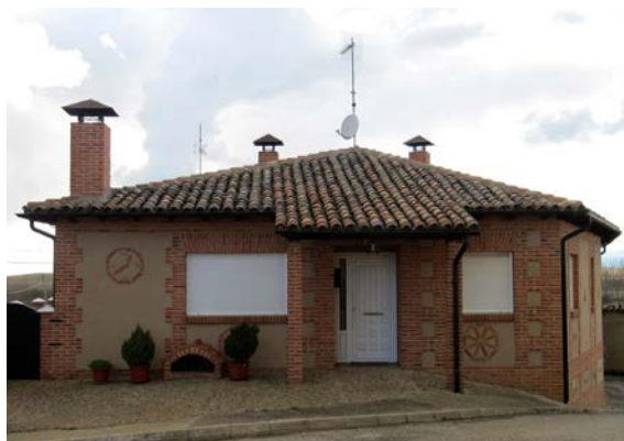
Figura 12. Un tipo de casa de emigrante en Grajal de Campos (León, España).

La ampliación y nueva conceptualización de la arquitectura vernácula obliga asimismo a considerar el posible valor de todas aquellas obras desechadas por no ajustarse a los paradigmas canónicos, como las fechorías ("malfeitorias") repudiadas por los modernos arquitectos del Inquérito à Arquitectura Popular em Portugal y que no encajaban con su percepción idealizada de lo popular (Leal, 2011). Ciertamente autores como Ernesto Veiga de Oliveira en su Arquitectura Tradicional Portuguesa (escrito en 1970) o Carlos Flores en su Arquitectura popular española (1973) llegaron a dejar entrever alguna sensibilidad hacia las expresiones del vernáculo contemporáneo 3 , pero para acabar ahogándola en la visión tradicional del concepto. Hubo que esperar a finales del siglo pasado para que en Portugal construcciones como las casas de emigrante empezaran a ser valoradas como expresiones culturales (Raposo, 2016). Y aunque esto no signifique de forma alguna que debamos abandonar a su suerte al vernáculo histórico, que olvidemos la tradición o que nos sumemos de manera acrítica al todo vale , lo cierto es que es hora de asimilar los testimonios de nuestra propia época, tal y como vienen reclamando autores como João Leal, uno de los antropólogos que más brillantemente ha abordado las causas y proceso de cambio de nuestras arquitecturas vernáculas (Leal, 2009 and 2011).