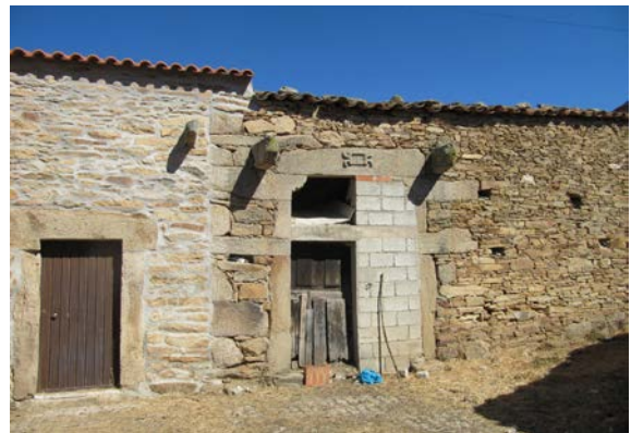
Figura 3. Convivencia de lo culto, el vernáculo relicto y el actual en Vale de Mira (Trás-os-Montes, Portugal). Fotografía del autor.

existir en las ciudades o que todo lo rural lo es. Se trata de una diferenciación ficticia en el caso de la arquitectura y que, en aras de clarificar conceptos, los tergiversa y confunde. Al igual que sucede con la dicotomía culto–popular, es frecuente que los mismos autores que las toman como referencia admitan las dificultades a la hora de clasificar las obras o conjuntos, e incluso que similares manifestaciones tengan interpretaciones contrarias, en función de si se ubican en una aldea o en una ciudad. Porque lo cierto es que la arquitectura forma parte de un único y complejo sistema cultural. No se deben juzgar las obras según su apariencia o ubicación, sino atendiendo a su significado cultural, que es siempre complejo. Las arquitecturas son híbridas, al igual que heterogéneos son los factores que caracterizan a sus constructores o usuarios. Y a esto hemos de sumar el hecho de que muchos de los aspectos que hoy consideramos rurales hasta hace bien poco formaban parte consustancial del mundo urbano, o que ciertas localidades tomadas por “rurales” tuviesen un funcionamiento más bien urbano en otras épocas.