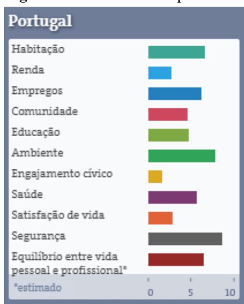
Figura 4. Indicadores de qualidade de vida em Portugal

Em 2020, Portugal, em comparação com outros países, tinha um desempenho positivo relativamente a alguns dos indicadores do Better Life Index (OCDE, s.d.). Apresentava um desempenho relevante em questões relacionadas com a habitação, segurança e qualidade do meio ambiente, como a seguinte figura ilustra: