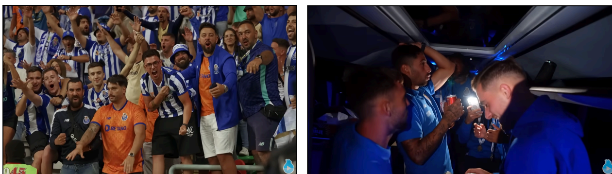
Figura 4 e 5. Momentos emotivos de ligação adeptos-equipa no Vlog FC Porto-Sporting

Um exemplo claro desta abordagem é o vlog "A épica vitória na Supertaça" lançado após a final da Supertaça, onde o FC Porto venceu o Sporting por 4-3, que acompanha todo o ambiente do jogo dentro e fora do estádio, com imagens e depoimentos de adeptos, os momentos capitais do jogo, o momento em que a equipa levanta a taça, na perspetiva de um jogador e por fim, o percurso até ao porto e a receção dos adeptos à equipa.