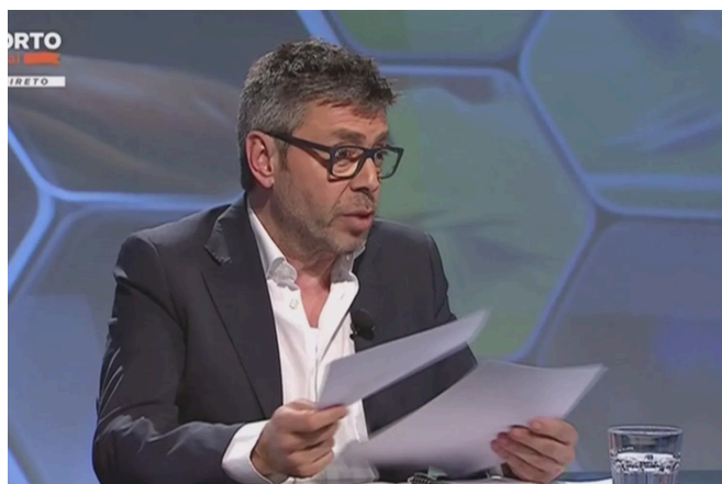
Fig 6. Divulgação dos E-mails no programa “Universo Porto da Bancada”

Um exemplo claro para entender a ausência do contraditório e imparcialidade em meios controlados por clubes é a do caso da divulgação de E-mails do SL Benfica, que remonta a 2017-18.