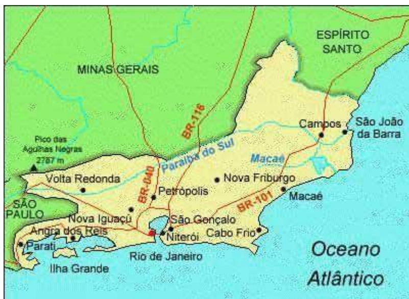
Figura1: Mapa do município de São Gonçalo/RJ