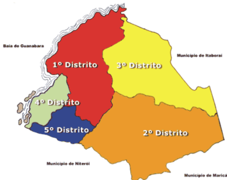
Figura 2: Distritos de São Gonçalo