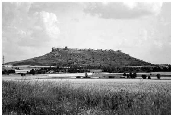
Fortaleza califal de San Esteban de Gormaz

Os novos governadores mostram-se bastante tolerantes para com a população autóctone. Não há praticamente re-