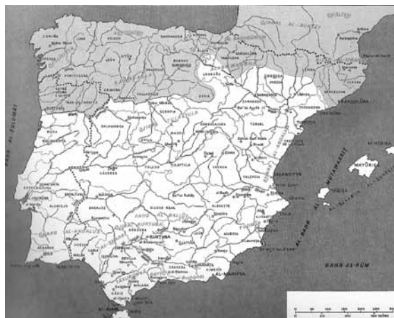
Mapa do al-Ândalus em meados do séc. XI (M. Barrucand/A. Bednorz)

Estes vestígios confundem-se, não raras vezes, com os de outros tempos, sejam eles romanos, visigóticos, moçárabes ou românicos e prolongam-se no tempo em manifestações de carácter mudéjar... A acuidade terá pois que ser grande para a sua decifragem e interpretação. Muitas das fortificações foram construídas onde antes eram postos de defesa das povoações castrejas e romanas, como sucede por exemplo no castro da Mogueira em S. Martinho de Mouros ou no próprio castelo de Lamego. Antigas igrejas visigóticas deram lugar a mesquitas e morábitos e posteriormente a igrejas moçárabes, como parece ser o caso do pequeno templo de Balsemão perto de Lamego e S. Frutuoso de Montélios, nas proximidades de Braga. Outras transformaram-