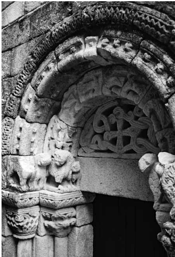
Portal da Igreja de S. Pedro das Águas, Tabuaço