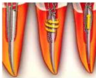
Figura 2: Remoção de instrumento fraturado com recurso a limas H (adaptado de Cohen & Hargreaves, 2011)

Esta técnica requer a criação de mais espaço em torno do instrumento fraturado, para inserir as limas Hedstrom o mais apicalmente possível em dois ou três pontos. Após a sua colocação é aplicada uma força moderada ocorrendo torção no sentido horário. Isto fará com que o fragmento seja preso e posteriormente tracionado como um todo. Caso falhe na primeira tentativa, deve-se proceder de igual forma mas substituindo as limas por umas de calibre superior. (Cohen & Hargreaves, 2011)