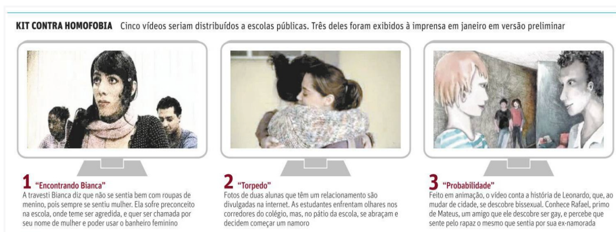
Figura 16 - Veto a kit só considera igreja, diz educador