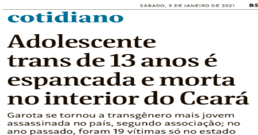
Figura 21 - Adolescente trans de 13 anos é espancada e morta no interior do Ceará