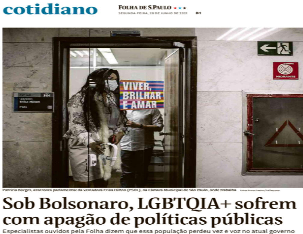
Figura 28 - Sob Bolsonaro, LGBTQIA+ sofrem com apagão de políticas públicas