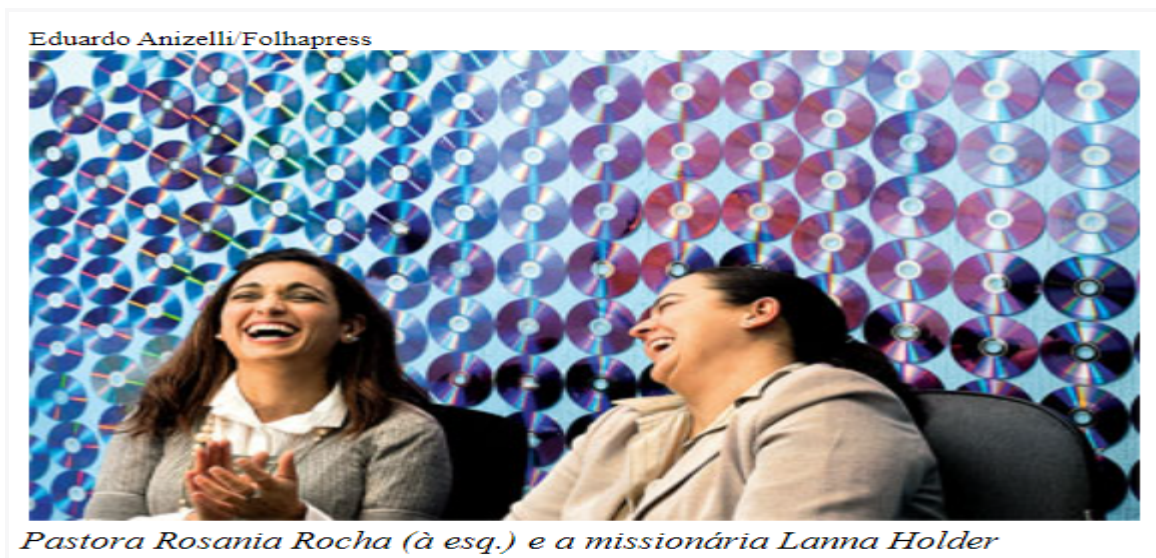
Figura 19 - Lésbicas de Cristo -Igreja evangélica fundada por mulheres homossexuais no centro de São Paulo quer acolher " escorraçados pela intolerância"