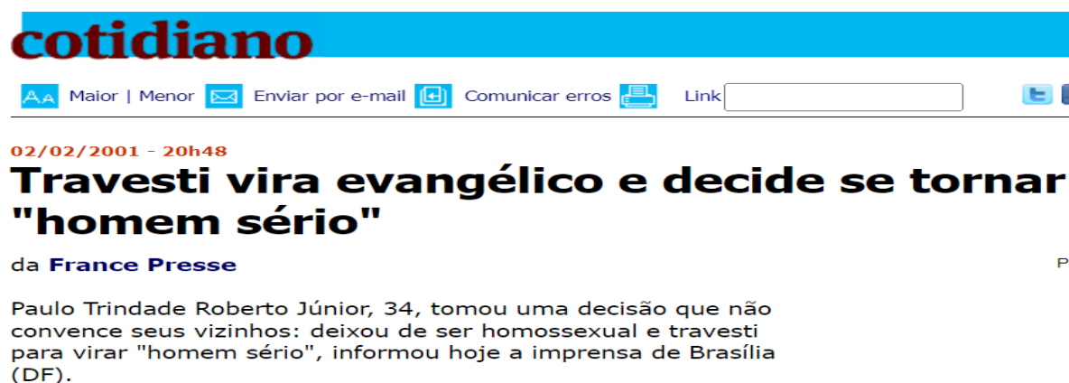
Figura 3 - Travesti vira evangélico e decide se tornar homem sério