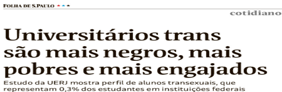
Figura 23 - Universitários trans são mais negros, mais pobres e mais engajados