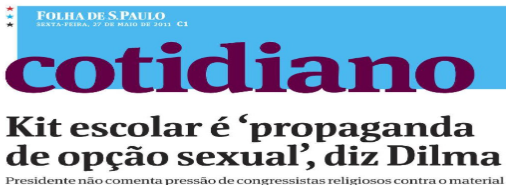
Figura 15 - Kit escolar é ‘propaganda de opção sexual’, diz Dilma