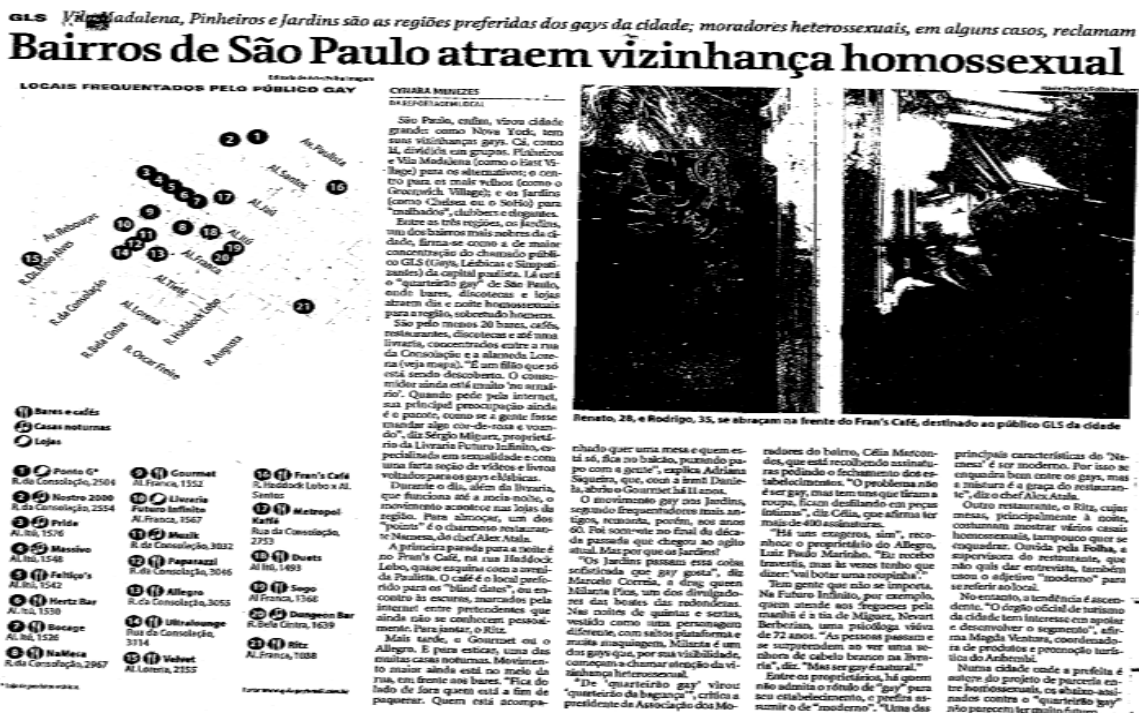
Figura 6 - Bairros de São Paulo atraem vizinhança homossexual