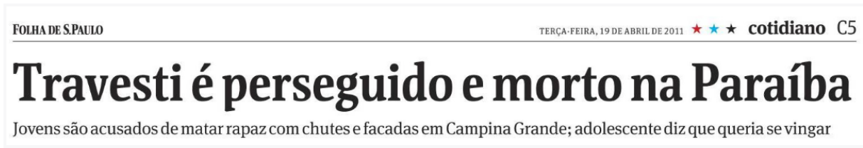
Figura 10 - Travesti é perseguido e morto na Paraíba