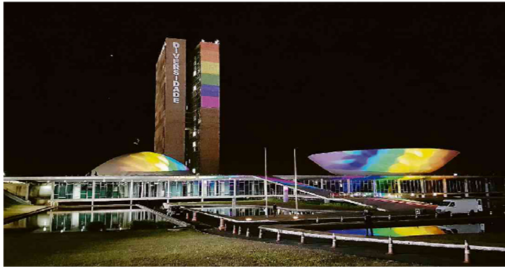
Congresso Nacional, em Brasília, iluminado pelo coletivo Brasília Orgulho com as cores do movimento LGBTQIA+ nesta segunda (28) - Ilustração de Sui/Agência de Notícias