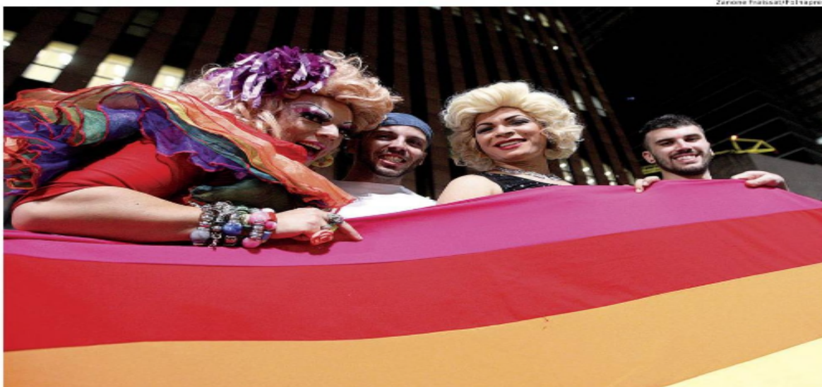
Simpatizantes da causa gay comemoraram resultado do julgamento do Supremo na avenida Paulista, na noite de ontem

Supremo decide que não há mais no país diferença entre as relações estáveis de heterossexuais e homossexuais