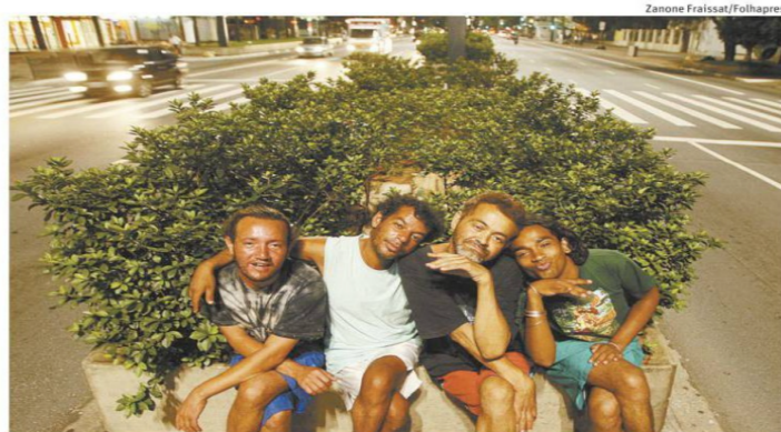
Grupo de moradores de rua homossexuais que andam juntos pela região da av. Paulista

Eles preferem ser chamados por nomes femininos, como Giovanna Antonelli