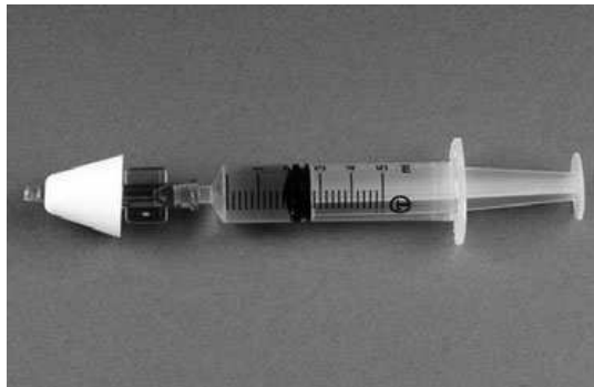
Figura 2- Dispositivo de atomização mucosa para administração intranasal. (Adaptado de Gilchrist et al. 2007)

O midazolam por via intranasal tem provado ser bom para pacientes com necessidades especiais mas o médico tem que ser capaz de entubar o paciente. Neste caso é necessária a administração de flumazenil para reverter o efeito do midazolam. Para além disso, é necessário um oxímetro de pulso para medir os níveis de saturação do oxigénio (Charon 2011). A dosagem recomendada é de 0,2-0,3 mg/kg e o início de acção varia entre 5-10 minutos. Gilchrist et al. (2007) afirmam que a dosagem pode variar de 0,2 mg/kg a 0,6 mg/kg e segundo Mortazavi et al. (2008) pode variar entre 0,2 e 1.0 mg/kg. A biodisponibilidade por via intranasal é bastante superior do que na via oral, ronda os 55%. O início de acção e recuperação também são mais rápidos do que na via oral.