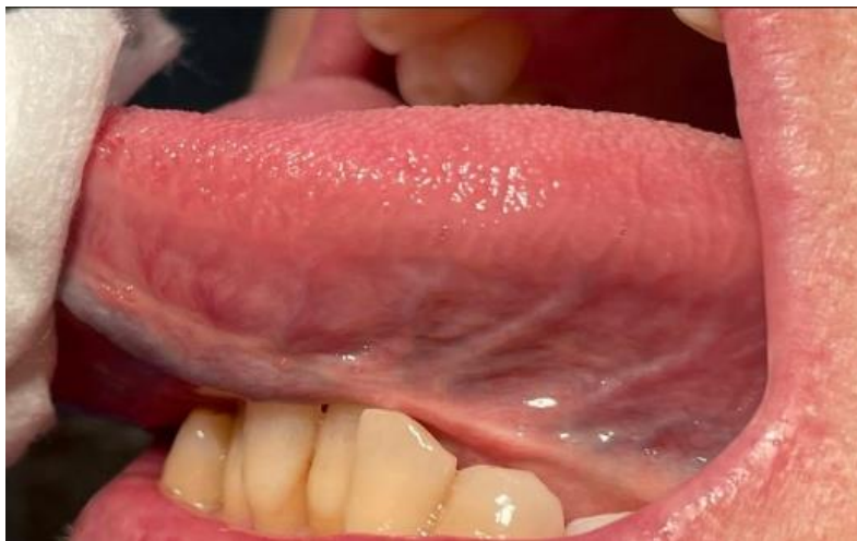
Figure 6. Fotografia do bordo lateral esquerdo da língua.

Na mucosa jugal da paciente o ducto de Stenon é bem visível não apresentando obstruções ou inflamação óbvia; no lado esquerdo o ducto parece um pouco dilatado, outra das características associada à alteração do fluxo salivar (Figuras 7 e 8).