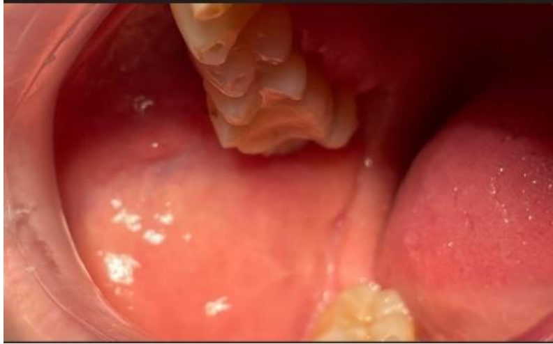
Figure 7. Fotografia da mucosa jugal direita com ducto.