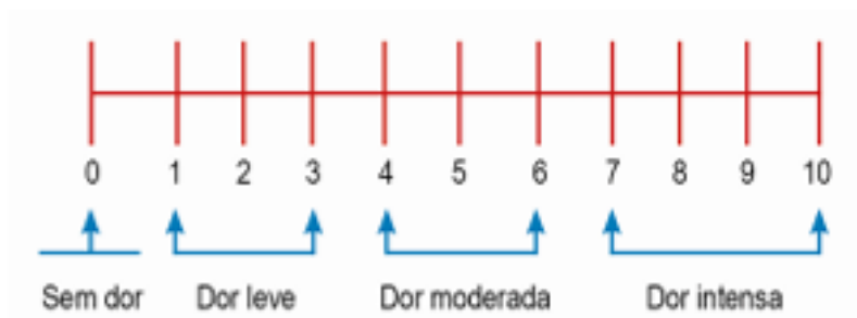
Figure 2. Escala com intensidade da dor (adaptado de Ettlin et al, 2016).