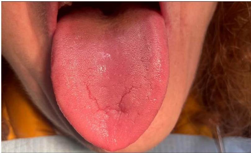
Figure 4. Fotografia frontal da língua.