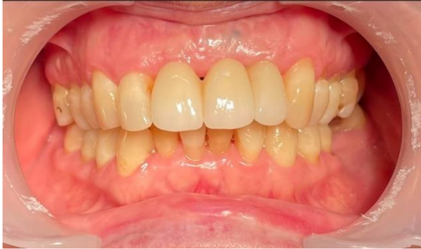
Figure 3. Fotografia frontal em oclusão com retração dos tecidos periféricos.