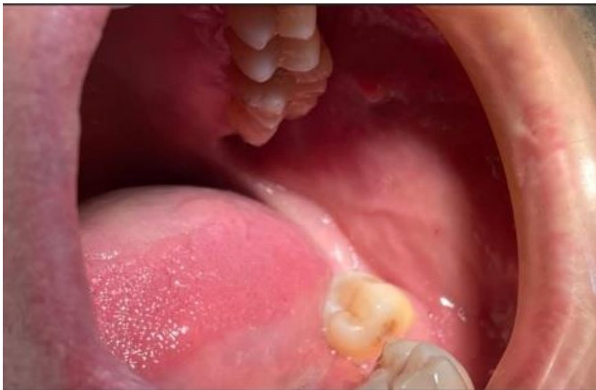
Figure 8. Fotografia da mucosa jugal esquerda.

Apresenta múltiplas restaurações: no primeiro quadrante: 13, 14, 15 e 16; no segundo quadrante: 23, 24, 25 e 26; no terceiro quadrante: 31, 32, 34e 35; no quarto quadrante: 41, 44, 45 e 46. Observam-se lesões cervicais não cariosas devidas a traumatismo oclusal nos dentes: 13, 14 23, 24, 25, 44 e 45 (Figura 5 e 6).