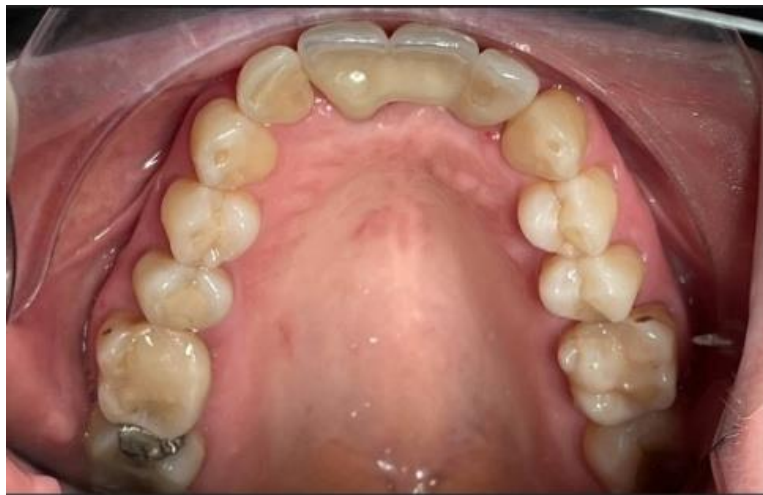
Figure 9. Fotografia oclusal superior.

-No primeiro quadrante, dente 11 colocação de implante com prótese fixa (coroa), dentes 12, 13, 14 são, classificados como '0' no Código CPO, dente 15 obturado em resina composta na face OD (ocluso-distal) classificado como '2' no Código CPO, dente 16 obturado em resina composta na face OM (ocluso-mesial) classificado como '2' no código CPO, dente 17 obturado com amálgama em M (mesial) classificado como '2' no código CPO e dente 18 ausente, perdido por cárie, classificado como '3' no código CPO. No segundo quadrante, dentes 21 e 22 colocação de implante com prótese fixa (coroa), dente 23 e 24 e 27 são, classificados como '0' no código CPO, dente 25 obturado em resina composta face M (mesial) classificado como '2' no código CPO, dente 28 perdido por cárie classificado como '3' no código CPO. No terceiro quadrante, dentes 31,32,33,34,35 e 37 são classificados como '0' no código CPO, dente 36 perdido por cárie classificado como '3' no código CPO. Quatro quadrante 41,42,43,44,46 e 47 dentes são, classificados como '0' e dente 45 obturado em D (distal) em resina composta classificado como '2'.