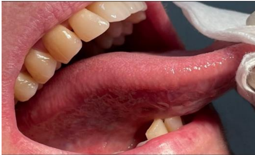
Figure 5. Fotografia do bordo lateral direito da língua.