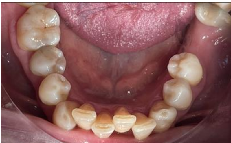
Figure 10. Fotografia oclusal inferior.