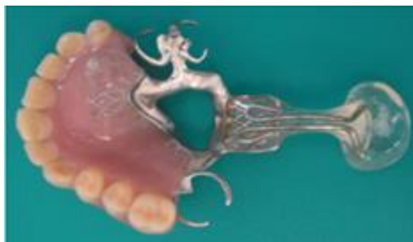
Figura 1 – Prótese obturadora com bulbo faríngeo. Imagem retirada de Freitas et al. (2011)

A prótese elevadora é outro tipo de prótese que consiste num aparelho intra-oral removível com uma extensão (porção elevadora) feita de resina, a qual tem a finalidade de elevar o palato mole em direção à parede posterior da faringe (fonte retirada da página da faculdade de odontologia de Bauru, disponível em http://143.107.25.4/depart/baf/protosedepalato/indicacoes.htm [Consultado em 05/01/2016]).