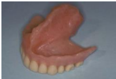
Figura 3 – Prótese obturadora convencional para paciente edêntulo. Imagem retirada de Lin et al. (2011)

Aquando a inserção da prótese em boca, no bloco cirúrgico, pode ser necessário proceder a ajustes do dispositivo realizando-se então um rebasamento direto, comumente com recurso à resina autopolimerizável, pelo que torna-se crucial a presença de um profissional capacitado para tal situação (Sá, 2010).