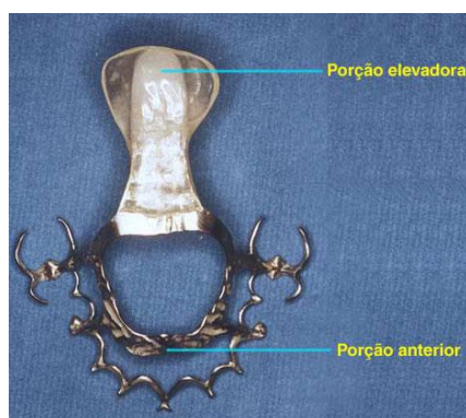
Figura 2 – Prótese elevadora do palato. Imagem retirada da página da faculdade de odontologia de Bauru em http://143.107.25.4/depart/baf/protosedepalato/indicacoes.htm [Consultado em 05/01/2016].

A porção anterior é uma prótese convencional que pode ser uma prótese parcial removível, placa acrílica ou sobredentadura. Não pode ser uma prótese total devido à falta de retenção para segurar a porção elevadora. A porção elevadora tem a função de elevar mecanicamente o palato. A moldagem tanto o bulbo faríngeo da prótese obturadora quanto da porção elevadora da prótese elevadora são realizados por meio da nasofaringoscopia (fonte retirada da página da faculdade de odontologia de Bauru, disponível em http://143.107.25.4/depart/baf/protosedepalato/indicacoes.htm [Consultado em 05/01/2016]).