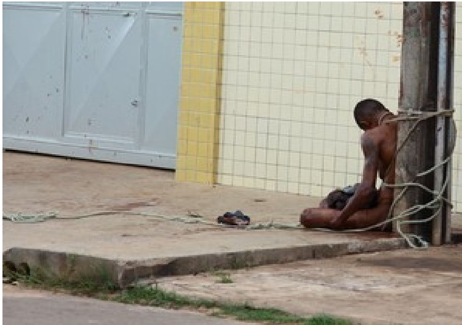
Foto 3 - Linchamento de um jovem no bairro do Cidade Operária, cidade de São Luís, Maranhão, Brasil