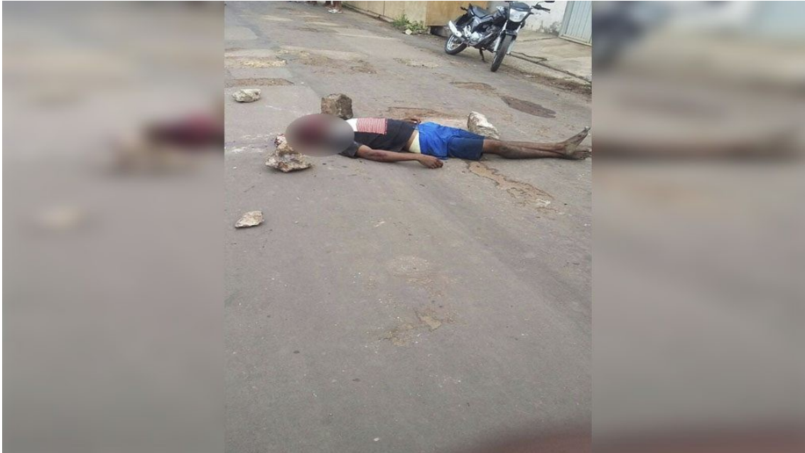
Foto 5 - Linchamento de dois jovens no bairro do Bequimão, cidade de São Luís, Maranhão, Brasil