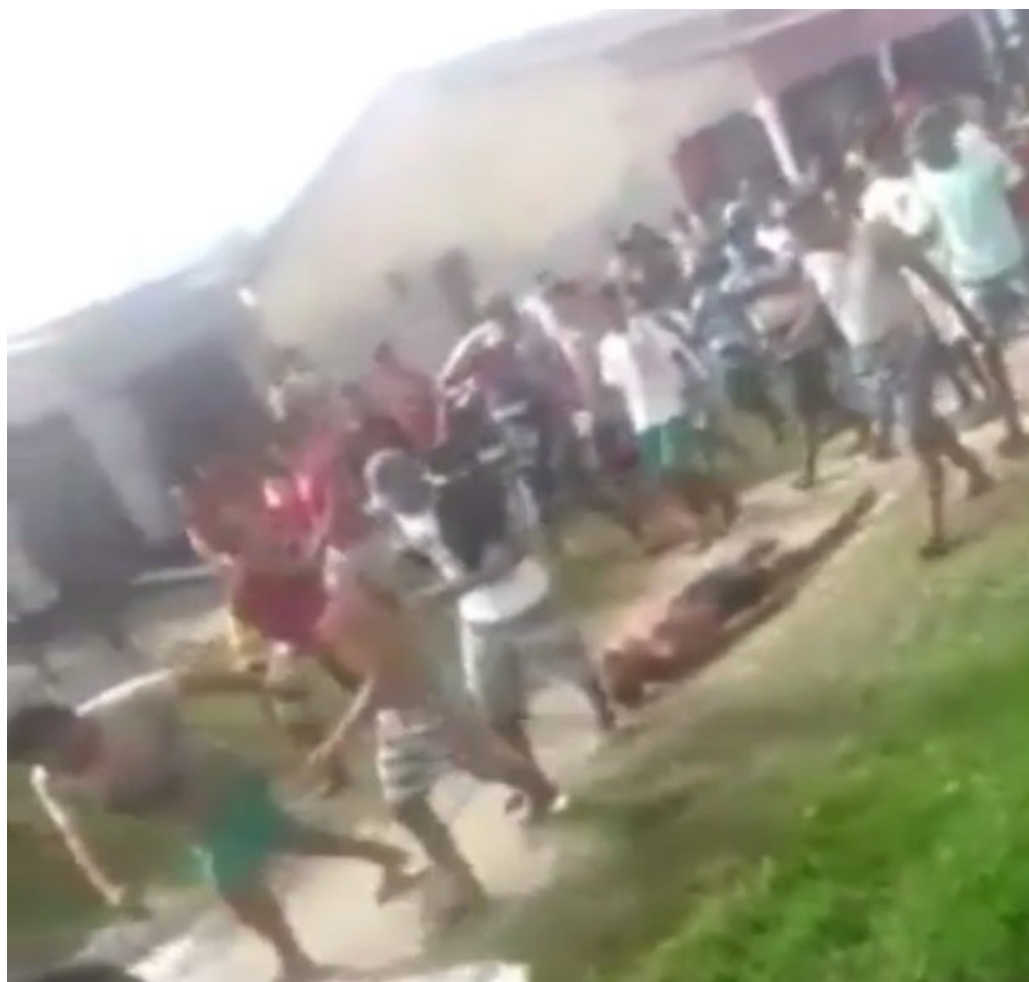
Foto 1 - Linchamento na cidade de Araióse, Maranhão, Brasil