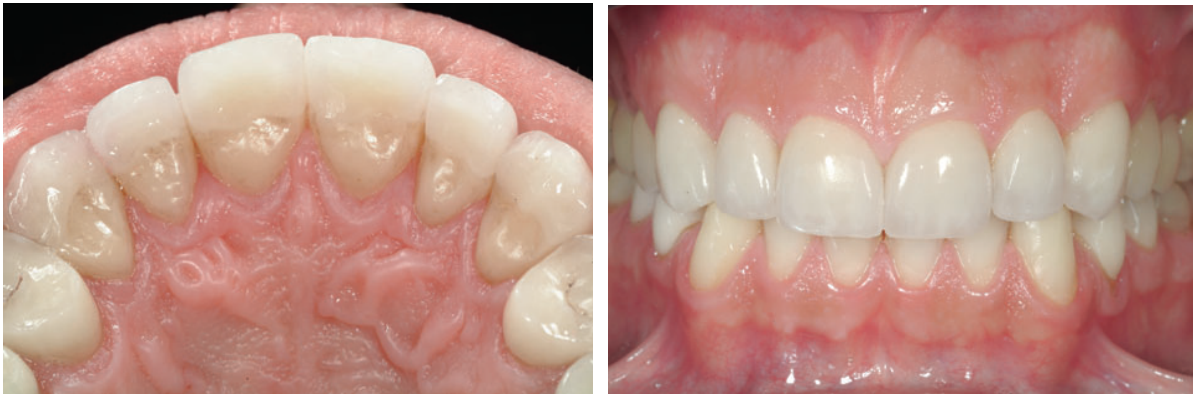
Figura 5 e 6 – Reabilitação dentária com onlays palatinos e facetas cerâmicas vestibulares nos dentes anteriores maxilares. Retirado e adaptado de Vailati et al., 2008.