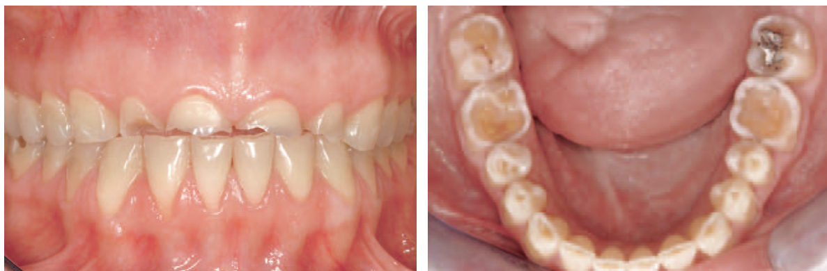
Figura 1 e 2 – A erosão dentária é caracterizada pela remoção de tecido dentário duro. Cavidade oral de um paciente que sofreu bulimia. Erosão marcada por diferentes graus de perda de tecido dentário. Retirado e adaptado de Spreafico et al., 2010.