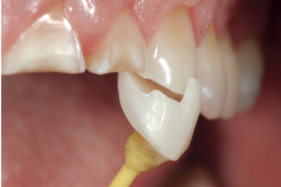
Figura 4 – Onlay palatino com gancho no bordo incisal, para facilitar o posicionamento e a estabilização do onlay durante a colocação no dente. Retirado e adaptado de Vailati et al., 2008.