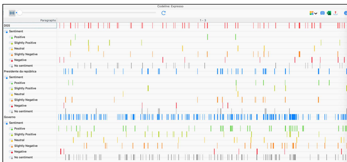
Ilustração 3 - Sentimentos das Menções à DGS, ao Presidente da República e ao Governo

No corpus de análise foram detetadas um total de 1098 referências diretas às Entidades Oficiais DGS (210), Presidência da República (180) e Governo (708). A ilustração 6 representa o mapeamento de sentimentos predominantes por entidade.