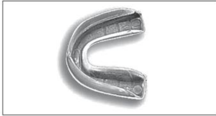
Figura 1. Protetor bucal pré-fabricado (Santiago et alii. , 2008).

Relativamente à posição, estes são fixos aos dentes do maxilar superior, sendo mantidos no lugar pela pressão dos dentes do maxilar inferior. Por conseguinte, funcionam sobretudo quando os arcos estão em oclusão, pelo que têm um efeito adverso sobre a respiração e concentração do atleta, oferecendo uma falsa sensação de segurança (Jerolimov, 2010).