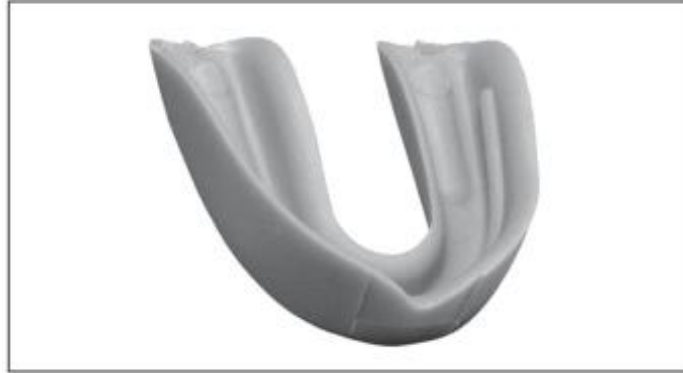
Figura 2. Protetor bucal pré-fabricado termoplástico (Santiago et alii. , 2008).

alii. , 2008). São feitos de silicone termoplástico ou polietilenovinilacetato e dirigidos a diferentes adaptações, tornando-se menos volumosos e mais confortáveis que os da classe I, pois o processo de fervura diminui a espessura ( Figura 2 ).