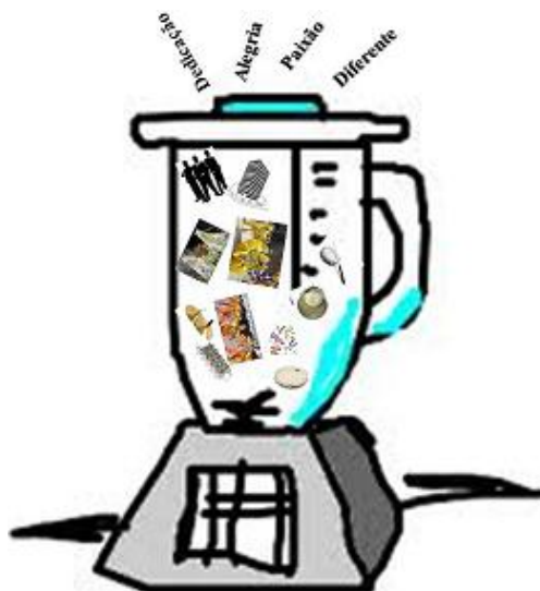
Figura 1 – Ingredientes de cumplicidade

A sensação de deslumbre com todos os ingredientes integrantes do Carnaval, para a formação desta grandiosa festa, levou o autor desta dissertação a aprofundar-se nos bastidores, com o objetivo de entender o que está por trás desta verdadeira obra que ocorre anualmente.