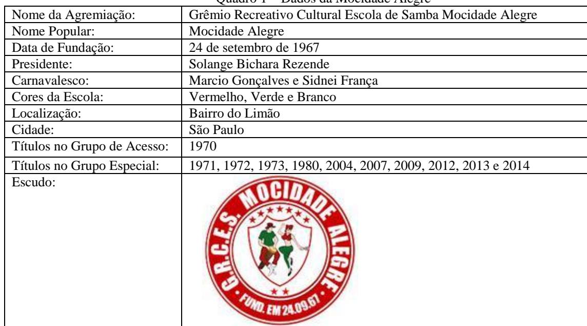
Quadro 1 – Dados da Mocidade Alegre

O Quadro 1, a seguir, apresenta alguns dados históricos da Escola: