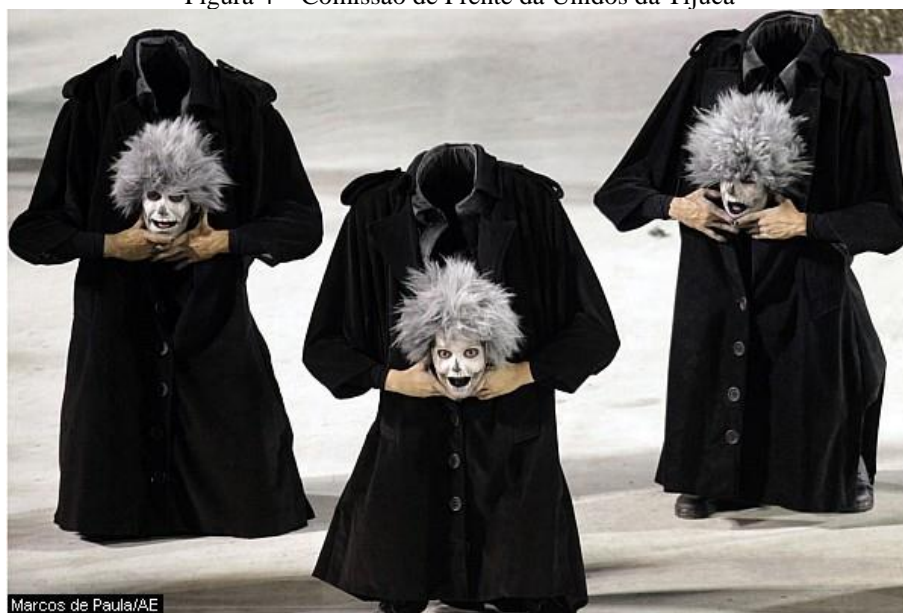
Figura 4 – Comissão de Frente da Unidos da Tijuca

Os zumbis tiravam a casaca e se organizavam em fila em frente à plateia. Lentamente, as cinturas se separavam das pernas, como se o corpo tivesse sido cortado ao meio, e parte ia para um lado e parte para outro, uma ilusão perfeita da separação da cintura das pernas. Eu lembro que, passado algum tempo do dia do desfile, encontrei gravações do público no dia dessa apresentação da comissão de frente da Unidos da Tijuca. Pude ver as reações de êxtase de quem gravou esse momento do desfile. As pessoas xingavam e gritavam por não acreditarem no que viam.