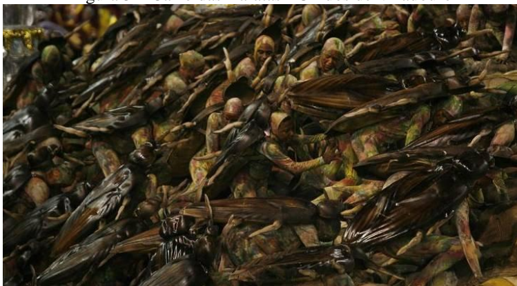
Figura 3 – Carro das Baratas - Unidos de Viradouro