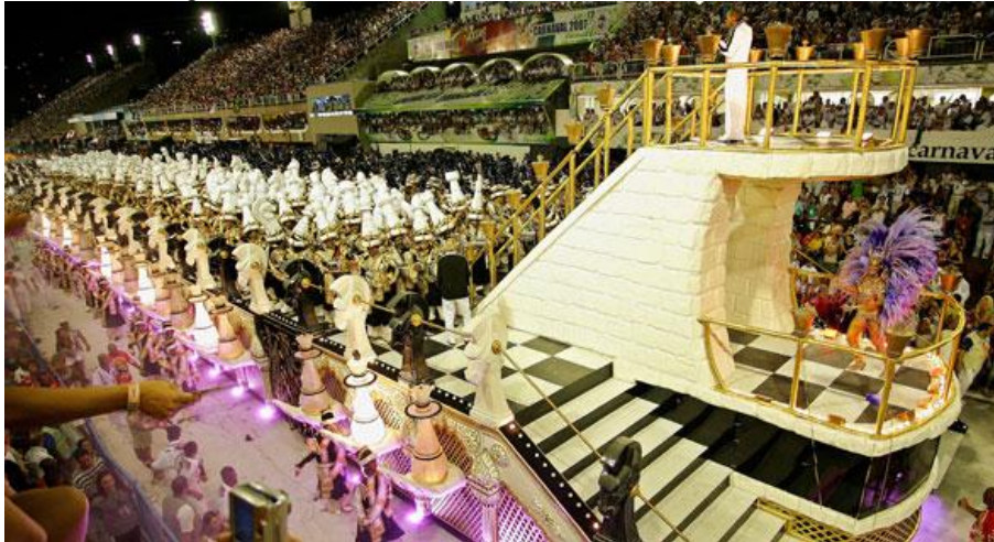
Figura 5 – Carro Castelo de Cartas – Unidos de Viradouro

O que você precisa fazer para ver um castelo de cartas de cabeça para baixo sem derrubá-lo? Então? Já inclinou a sua cabeça? Está quase ‘plantando uma bananeira’ para ver a alegoria? Essas perguntas foram feitas aos jurados durante o desfile da Viradouro vira o jogo, em 2007, ao lerem o Abre-alas, documento que contém as defesas do enredo das escolas de samba do Grupo Especial do Carnaval carioca. Quando a alegoria ‘Castelo de Cartas’ passou na Avenida, ninguém plantou bananeira, mas que entortaram o pescoço, isso eu vi. A ideia do ‘Castelo de Cartas’ surgiu a partir de uma imagem que eu encontrei durante a pesquisa de uma escultura de cartas feitas por um desses fanáticos que montam instalações com muitos metros de altura.