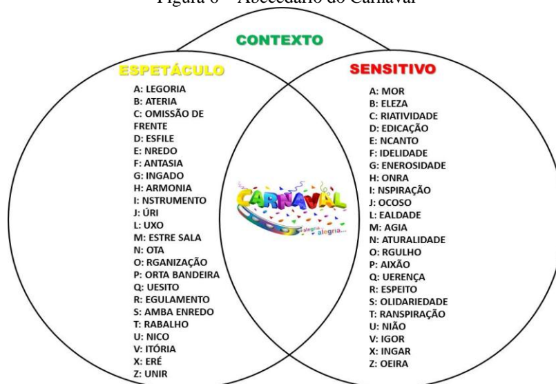
Figura 6 – Abecedário do Carnaval