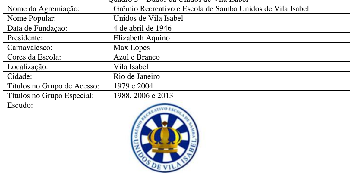
Quadro 3 – Dados da Unidos de Vila Isabel

O Quadro 3, a seguir, traz alguns dados históricos da Escola: