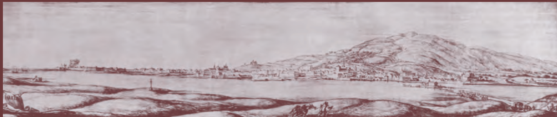
vista de viana (séc. xvii)