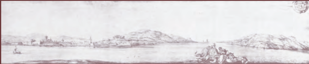
vista de viana (séc. xvii)