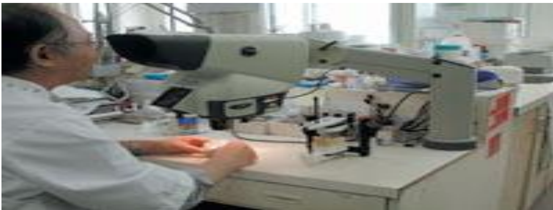
Figura 3: Confeção de uma prótese fixa com recurso à magnificação