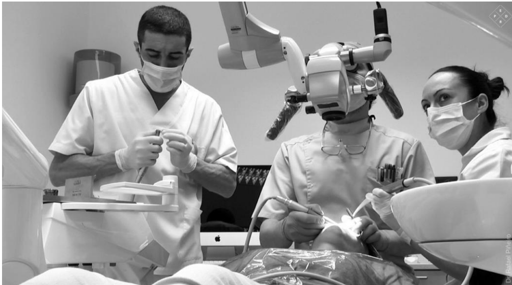
Figura 1: Trabalho em equipa com recurso à magnificação