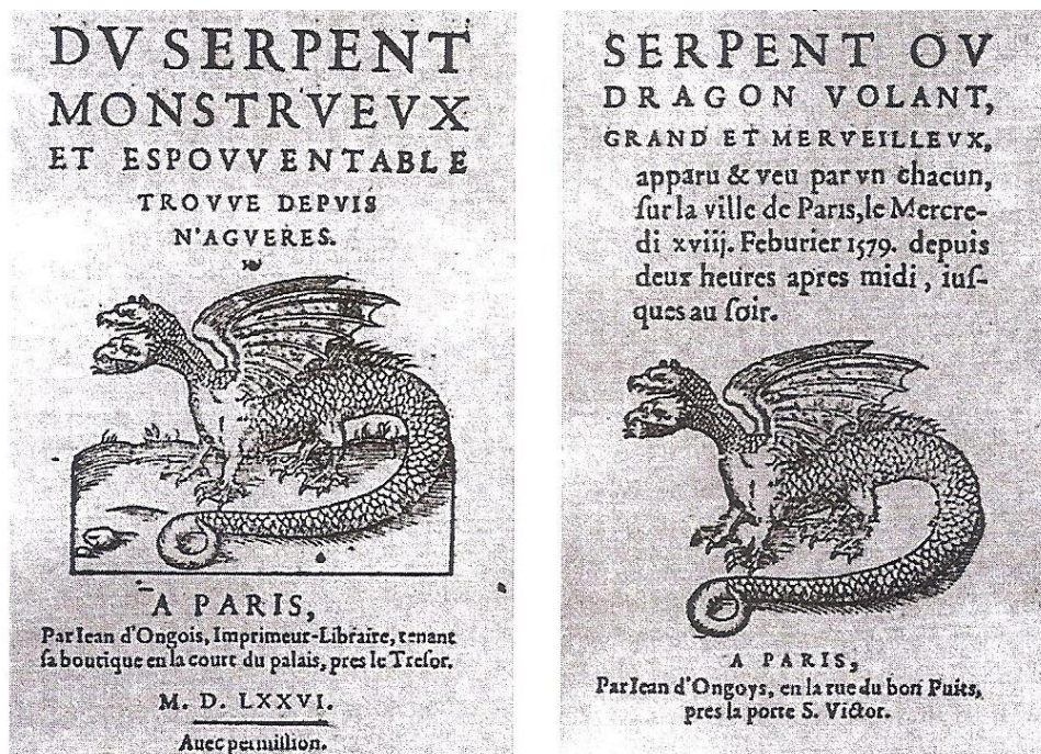
Figura 3 – Exemplo do sensacionalismo no século XVI

Estas eram as temáticas mais em voga pela simples razão de que o grande público gostava delas. Estes factos extraordinários apaixonavam uma quota-parte dos leitores porque eram capazes de interromper a monotonia da vida quotidiana e proporcionar momentos inusitados com a leitura de assuntos que versavam erupções vulcânicas, tremores de terra, crimes misteriosos ou feitos milagrosos (Weill, 2007, p. 24).