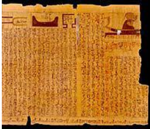
Figura 1 – Acta Diurna