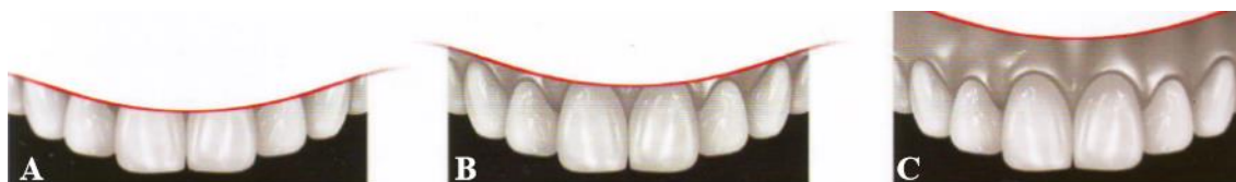
Figura 1: A - linha labial baixa; B - linha labial média; C - linha labial alta. Retirado e adaptado de: “ Invisible – Restauraciones Estéticas Cerámicas ” (Kina & Bruguera, 2008)

A grande maioria dos dentistas consideram que, durante o sorriso, o lábio superior deve posicionar-se ao nível da margem gengival dos incisivos centrais superiores. Mas é sabido que alguma quantidade de gengiva exposta durante o sorriso é esteticamente aceitável e, além disso confere uma aparência mais jovem ao indivíduo. Na literatura existem muitos parâmetros para definir o sorriso gengival (quantidade em milímetros de exposição da gengiva ao sorrir). Segundo a pesquisa realizada por Kokich Jr. et al. , somente ao atingir 4mm de exposição gengival o sorriso é considerado antiestético. Para os ortodontistas, mais exigentes, 2mm de exposição gengival ao sorrir são suficientes para considerar o sorriso esteticamente desagradável. A altura do sorriso é influenciada pelo sexo, em geral as mulheres apresentam sorrisos mais altos do que os homens e pela idade, exposição dentogengival diminui com a idade. Essa informação tem relevância clínica, uma vez que o sorriso gengival exhibe certo grau de autocorreção com o passar do tempo, principalmente em indivíduos do sexo masculino (Seixas et al. , 2011).