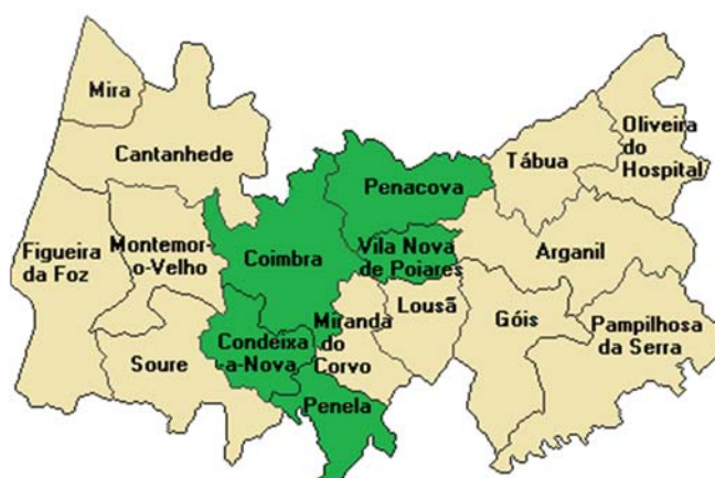
Figura 2 – Localização da área de atuação do Destacamento Territorial de Coimbra da GNR

É importante referir que a amostra a obter terá que obedecer a critérios como heterogeneidade e diversidade no que se refere a variáveis sociodemográficas como o género, idade e escolaridade.