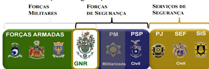
Figura n.º1 – Posição da GNR no Sistema Nacional de Forças

A GNR é uma força considerada de “charneira”, pois se em tempo de paz exerce funções policiais e de segurança, tendo como área de atuação cerca de 92% do território nacional e mais de 50% da população à sua responsabilidade, em período de conflito pode complementar a atuação das Forças Armadas, tendo em conta a sua natureza militar (Branco, 2010). A GNR assume uma posição que consiste num meio-termo entre as Forças Militares e as Forças de Segurança.