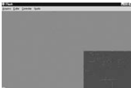
Figura 2 Três momentos de "Entropophagy", de André Vallias, in alire 11, Janeiro 2000