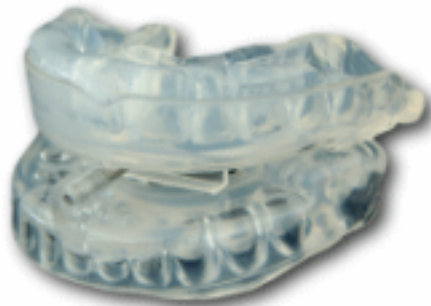
Figura 4 : Exemplo de dispositivo de avanço mandibular

( http://campus.cerimes.fr/dermatologie/enseignement/dermato_10/site/html/1.html )