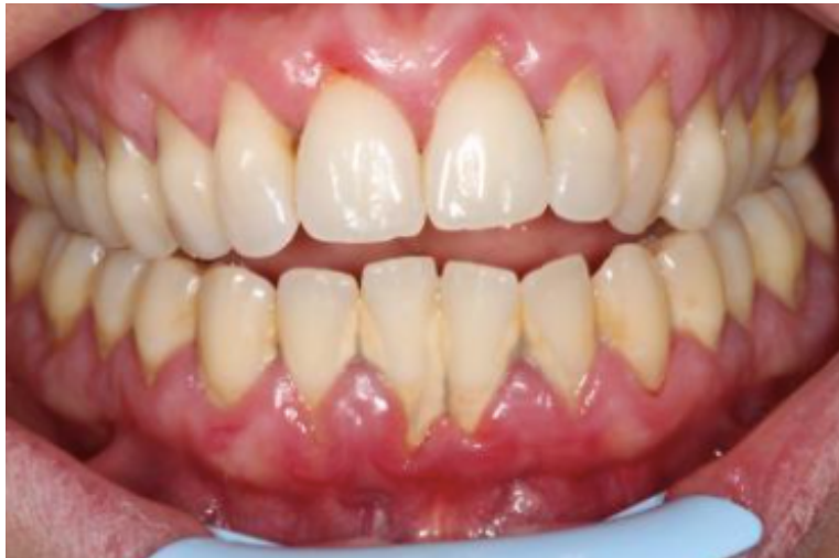
Figura 2 : Fotografia clínica de paciente que apresenta doença periodontal. ( https://dr-verge-samec-francoise.chirurgiens-dentistes.fr/content/la-parodontite )

[Adaptado de Pesci-Bardon e Prêcheur, (2011)]