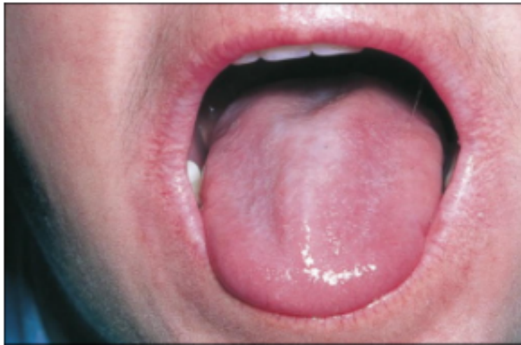
Figura 3: Fotografia clínica revelando uma língua despapilada, vermelha e brilhante, típica de candidose oral eritematosa.

( http://campus.cerimes.fr/dermatologie/enseignement/dermato_10/site/html/1.html )