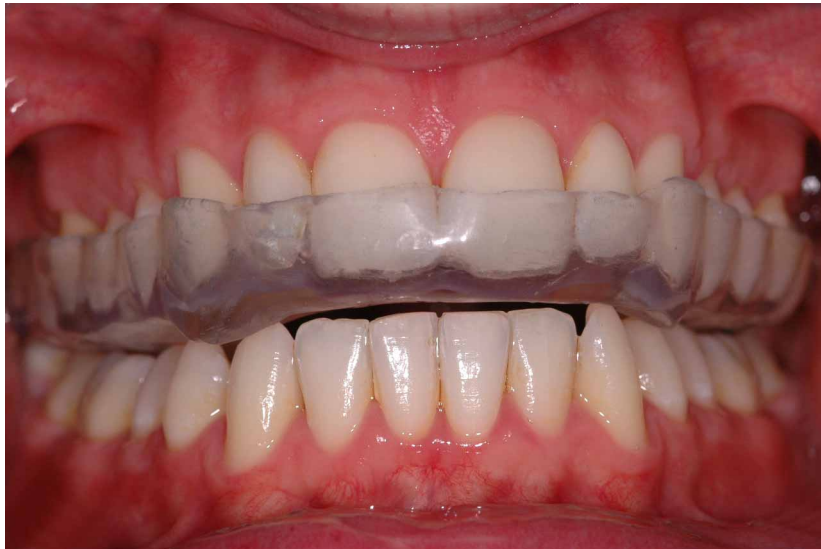
Figura 5 : Exemplo de placa oclusal em boca ( http://www.jardindesdents.ch/traitement/protheses-amovibles/gouttiere-de-liberation-occlusale-night-guard )