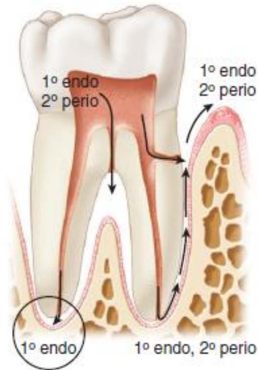
Figura 1. Lesão Endodôntica. Adaptado de (Cohen, 2011).