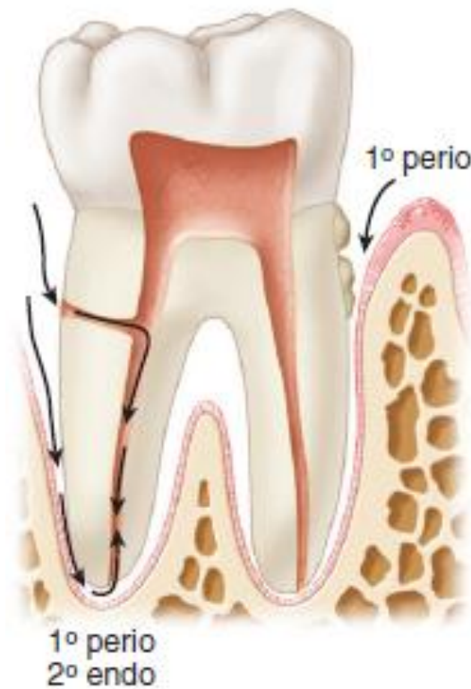
Figura 2. Lesão Periodontal. Adaptado de (Cohen, 2011).

Na Figura 2 pode-se observar lesões periodontais. Esta figura permite perceber a progressão da periodontite através dos canais laterais e do ápice para induzir uma lesão endodôntica secundária.