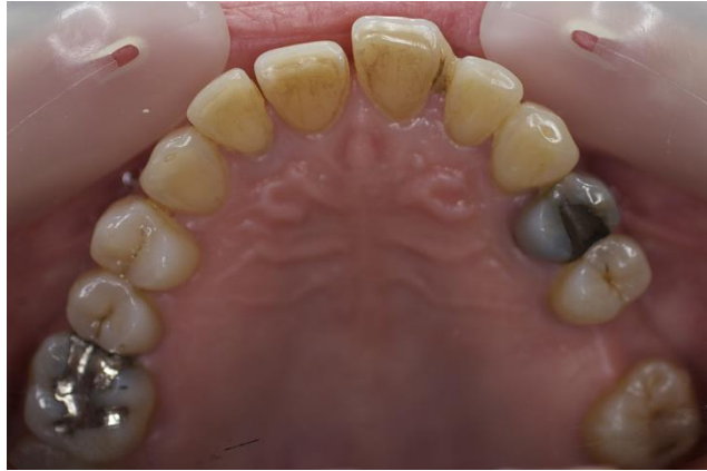
Figura 1: Migração patológica.