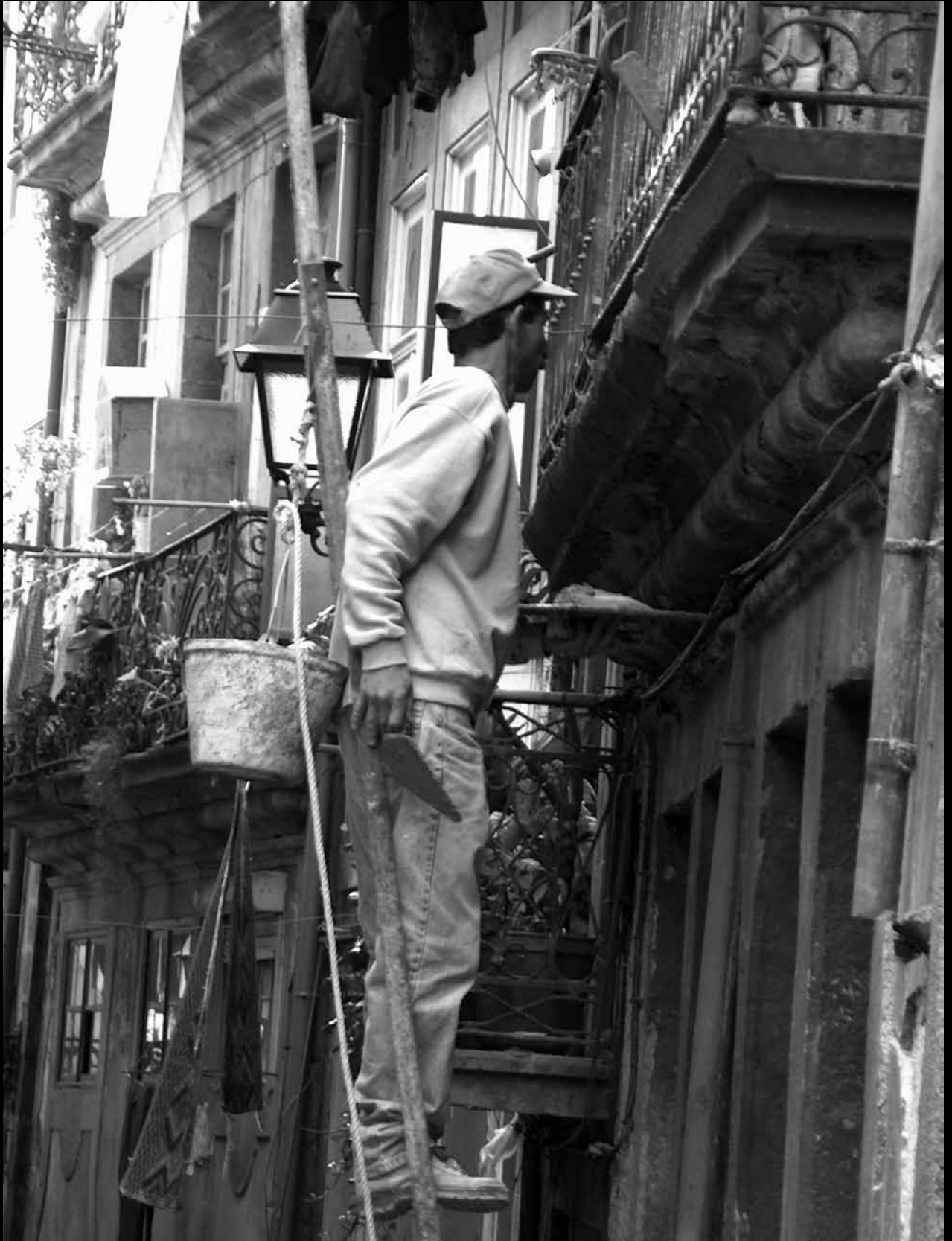
Fig.02 | Fotografia do Centro Histórico do Porto. Cadeira de Composição I - Visita de estudo. Março de 2004.