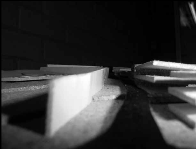
Fig.07 | Fotografia de maquete. Cadeira de Projecto I. Autoria : Manuel Gomes. Maio 2003.