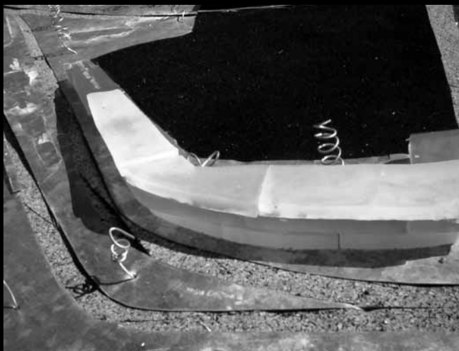
Fig.08 | Fotografia de maquete. Cadeira de Composição I. Autoria : Pedro Costa. Dezembro 2003

volventes, devido ao tipo de fluxo que geram, característico de certas actividades que são para eles deslocadas, e produzindo impactes significativos nos espaços adjacentes, resultando que uma localização e as suas características socio-espaciais podem abortar qualquer expectativa para um bom funcionamento de certas actividades em centros urbanos.