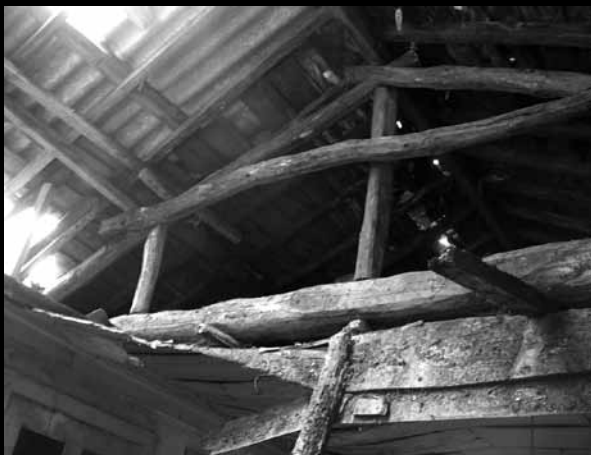
Fig.01 | Fotografia de edifício em recuperação no Centro Histórico de Gaia - Cadeira de Materiais de Construção - visita de estudo. Fevereiro de 2003

Do mesmo modo, os assuntos ambientais são parte do processo de regeneração urbana e da conservação do património (Cockshaw, 1996). São muitas as actividades que encontramos actualmente nos centros urbanos, das quais se destacam a hotelaria e o catering , cultura e lazer, banca e seguros, serviços administrativos, e nalguns casos serviços religiosos e a chamada gentrification , a habitação privilegiada no centro, de grupos sociais de grande poder económico, associada a elevados padrões de qualidade. Este fenómeno de terciarização dos centros urbanos foi identificado em prati-