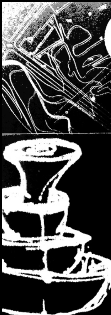
Fig.10 | Esquissos e planta. Cadeira de Projecto I. Autoria : Manuel Gomes. Maio 2003.

Emerge ainda o facto de as cidades voltarem a ocupar uma posição de preferência como lugares de residência, procurando a proximidade e a comodidade dos serviços urbanos. Identifica-se realmente uma atmosfera especial nos centros mais antigos que atrai diferentes tipologias sociais e convida ao regresso ao centro de grupos que progressivamente se haviam afastado. No entanto, em muitos destes processos não são garantidas as condições da equidade intrageracional, ocorrendo uma descaracterização total dessas áreas, em resultado da segregação espacial, que corresponde a uma perda irreparável em termos da herança cultural dos lugares, amputando o processo de conservação do património: a par da atractividade e do conjunto de oportunidades que se geram, aparecem os problemas ambientais e sociais.