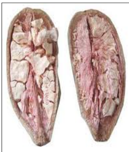
Figura 2. Apresentação do interior do fruto de Adansonia Digitata L., vulgarmente designado por múcua, baobab ou fruto do embondeiro.

No interior do fruto (Figura 2), a polpa encontra-se dividida em pequenos aglomerados, que contêm filamentos (fibras castanhas) que subdividem a fruta por segmentos, sendo necessária para a sua separação apenas um ligeiro processo mecânico, sem nenhum processo de extração, concentração ou tratamento químico, assegurando assim as características de um alimento minimamente processado (Nour et al. , 1980).