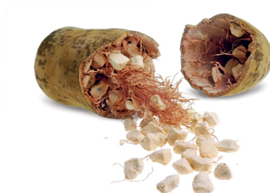
Figura 5. Aspeto interior do fruto de Adansonia digitata L.

Foram analisados frutos de Adansonia digitata L. (Figura 5) provenientes de Angola, cidade de Benguela, colhidos em Novembro de 2011, época ideal para o seu consumo. Os frutos inteiros foram transportados de avião, hermeticamente selados e acondicionados a não sofrerem danos físicos nos frutos que poderiam influenciar negativamente as propriedades químicas do mesmo.