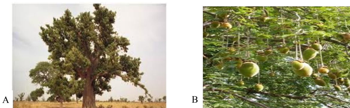
Figura 1. A) Árvore Adansonia digitata L.. B) Aspeto dos frutos.

Adansonia digitata L. (Figura 1) é uma espécie endémica africana, que se difundiu por diferentes regiões quentes e secas da África Tropical, caracterizada como uma árvore de grande porte, decídua e cuja altura oscila entre os 5 e os 25 metros (excecionalmente 30 m), e cuja longevidade pode atingir centenas ou milhares de anos sob condições favoráveis (Von Maydell, 1990). É conhecida como a “árvore da vida” devido à sua capacidade de retenção de água, bem como ao seu uso tradicional como medicamento e como alimento (Wickens e Lowe, 2008).