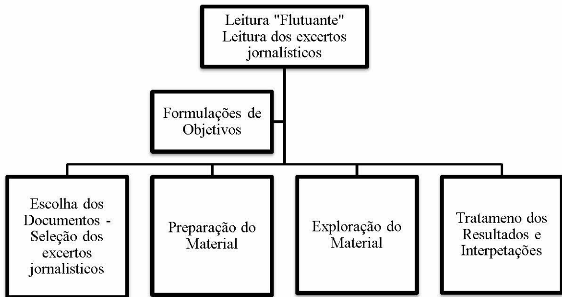
Figura 1. Organização da análise