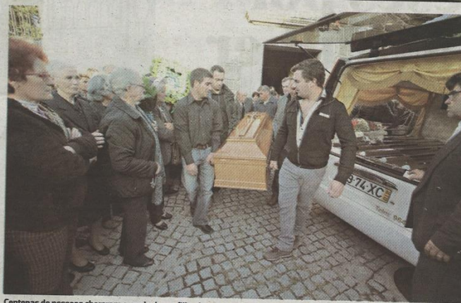
Centenas de pessoas choraram a perda de um filho da terra em Palhais, onde era muito estimado