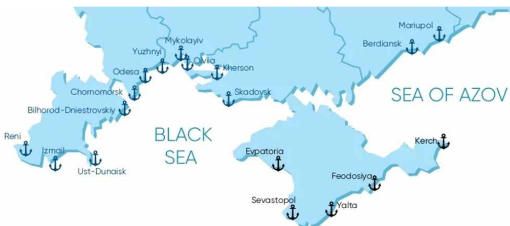
Figura 2 - Mapa dos portos marítimos em território ucraniano

Para além destes aspetos, a Ucrânia detém acesso a dois mares, o mar de Azov e o extenso mar negro, totalizando 2.782 km de linha de costa, com a posse de portos marítimos como o de Odessa, Mariupol e Sebastopol, totalizando dezoito portos marítimos em todo o país, cinco destes localizados na península da Crimeia. Dado o acesso ao mar ser algo reservado a pouquíssimos países na religião, constitui um elemento de valorização da localização do Estado ucraniano (Martins & Eugénio, 2019).