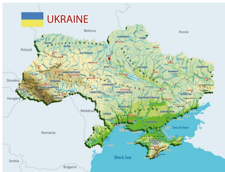
Figura 1: Mapa topográfico da Ucrânia