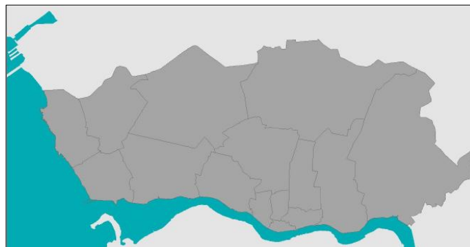
Figura 1. Ilustração exemplificativa de uma unidade geográfica de análise, a cidade do Porto, dividida em freguesias (Câmara Municipal do Porto, 2001).

Esta unidade geográfica de análise estará subdividida em outras unidades geográficas específicas, nomeadamente as circunscrições administrativas ou freguesias de uma cidade, e estas, por sua vez, divididas em sectores estatísticos, que são pequenas regiões geográficas delimitadas para o propósito de recenseamento.