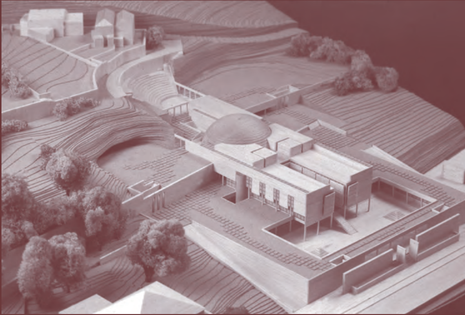
assembleia regional dos açores