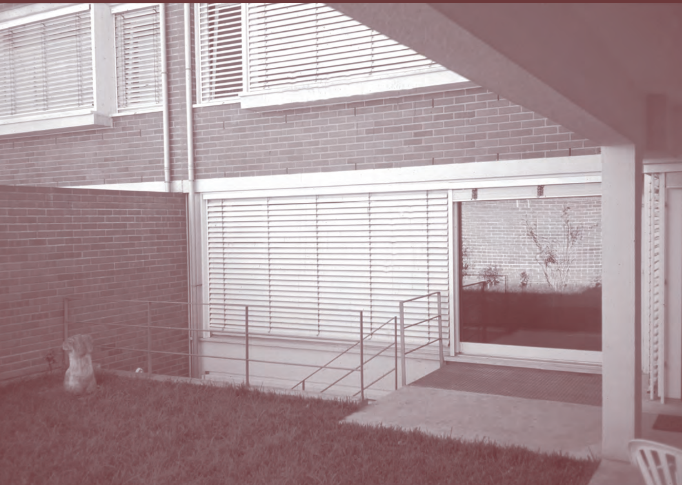
conjunto habitacional do aldoar (porto)