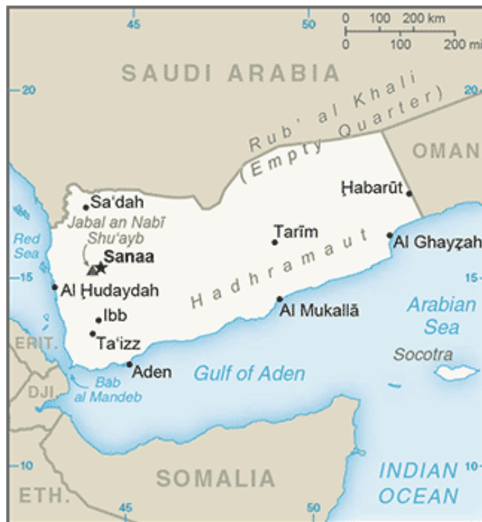
Figura 1. Mapa do Iémen

Geograficamente, o Iémen é um país árabe, ocupando a extremidade sudoeste da Península da Arábia. É limitado a norte pela Arábia Saudita, a leste por Omã, a sul pelo mar da Arábia e pelo golfo de Áden, do outro lado, do qual se estende a costa da Somália e a oeste pelo estreito de Bab-el-Mandeb, que o separa de Jibuti, e pelo mar Vermelho, que providencia uma ligação à Eritreia. Além do território continental, o Iémen inclui também algumas ilhas situadas ao largo do Corno de África, das quais a maior é Socotora (Wikipedia, 2019b).