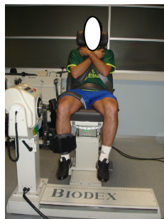
Imagem 1 – Dinamómetro isocinético Biodex System 4 Pro®

Critérios de exclusão: Atletas com lesões graves no último ano; atletas com feedback de dor durante a prova.