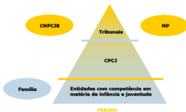
Figura 1: Modelo de Intervenção (retirado do site CNPCJP em 5-08-2014)

Foi então criado um modelo de intervenção para a maior proteção e promoção dos direitos das crianças e jovens.