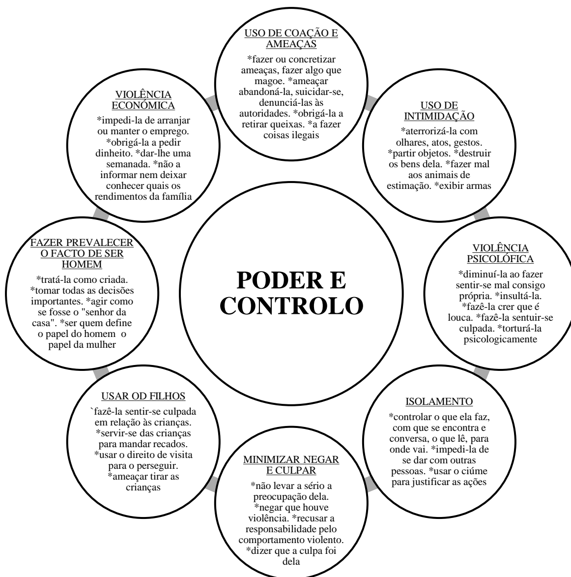
Gráfico 3 - Roda do Poder e Controlo de Duluth, DAIP, 1984

O agressor adota diferentes estratégias que sustentam o poder e o controlo sobre as suas vítimas. A Roda de Exercício do Poder e Controlo, apresentada na figura 1, criada pelo Domestic Abuse Intervention Project em 1984 explica essas dinâmicas e descreve um conjunto de formas de exercício da violência.