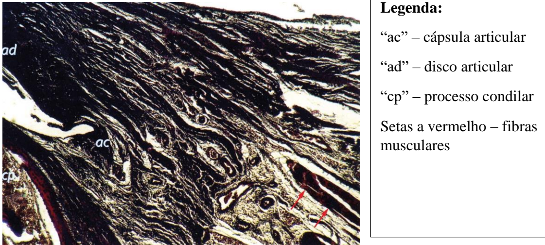
Figura 1 – Feto com 16 semanas de vida intrauterina (Adaptado de Alves, 2008)

A ATM é subdesenvolvida até ao nascimento, em comparação com as restantes articulações e é por isso mais suscetível no período pré e pós-natal, tendo, portanto, de continuar o seu desenvolvimento à posteriori , na consequência de movimentos de sucção e posterior mastigação (Bag et al. , 2014).