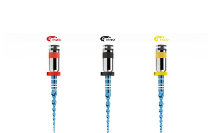
Fig.3) Representação das limas Reciproc Blue® R25, R40 e R50 (VDW, 2017b).

Este sistema de limas está dividido, exatamente, da mesma forma que o sistema Reciproc®, ou seja, podemos encontrar três limas com os mesmos diâmetros e conicidades (Yared, 2013).