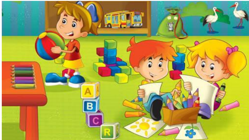
Figura 07: A diversão