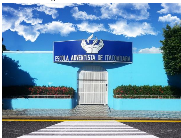
Figura 03: Fachada da Escola

Fundado em 20 de abril de 1982, EAI é um centro de ensino do setor privado, com turmas de Educação Infantil (Jardim I, II e III), Ensino Fundamental I (1º ao 5º Ano) e Fundamental II (6º ao 9º Ano). O maior público da escola é composto por alunos pertencentes à classe média, filhos de professores, médicos, empresários, funcionários do setor público ou privado e autônomos.