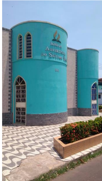
Figura 04: Capela da Escola

Com turmas de no mínimo 15 e no máximo 35 alunos, a Escola Adventista de Itacoatiara destaca-se entre outras (públicas e privadas) como uma escola de nível elevado com relação às suas propostas de ensino, tendo em vista que seus alunos são sempre muito bem preparados cognitivamente para outros níveis de ensino que em seu espaço físico não são ofertadas vagas e/ou turmas.