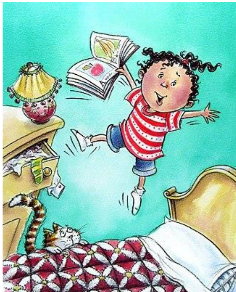
Figura 08: A liberdade