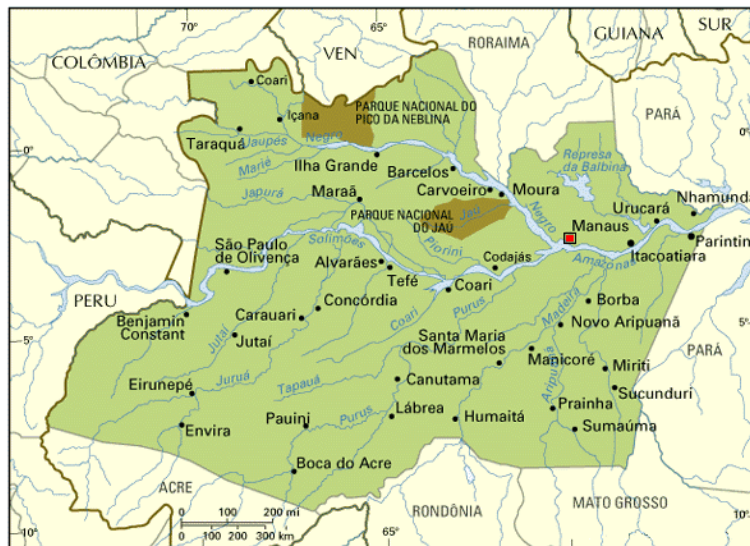
Figura 02: Localização Geográfica de Itacoatiara / AM

A nossa investigação foi desenvolvida na Escola Adventista de Itacoatiara, que se encontra na Avenida Conselheiro Ruy Barbosa, 674 - Centro, Itacoatiara - AM. A escola foco da referida pesquisa está localizada na cidade de Itacoatiara, estado da Amazônia, localizada na Região Norte do Brasil, e possui uma área de cerca de 5,5 milhões de km 2 . Fazendo parte de nove países: Brasil, Venezuela, Colômbia, Peru, Bolívia, Equador, Suriname, Guiana e Guiana Francesa, é a maior floresta tropical úmida do planeta e com a maior biodiversidade.