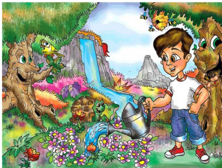
Figura 06: Nossa amiga natureza

Fonte: https://emersonfialho.wordpress.com/2007/12/28/nossa-amiga-natureza-livro-infantil/