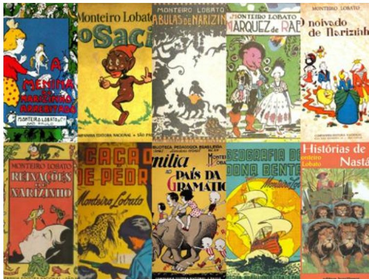
Figura 01: Livros de Monteiro Lobato

No século XIX, o nosso maior representante foi Monteiro Lobato, que “foi um dos que se empenharam a fundo nessa luta pela descoberta e conquista da brasilidade ou do nacional. A princípio na área da Literatura, seja para adultos ou para crianças”. (Coelho,1991, p.226).