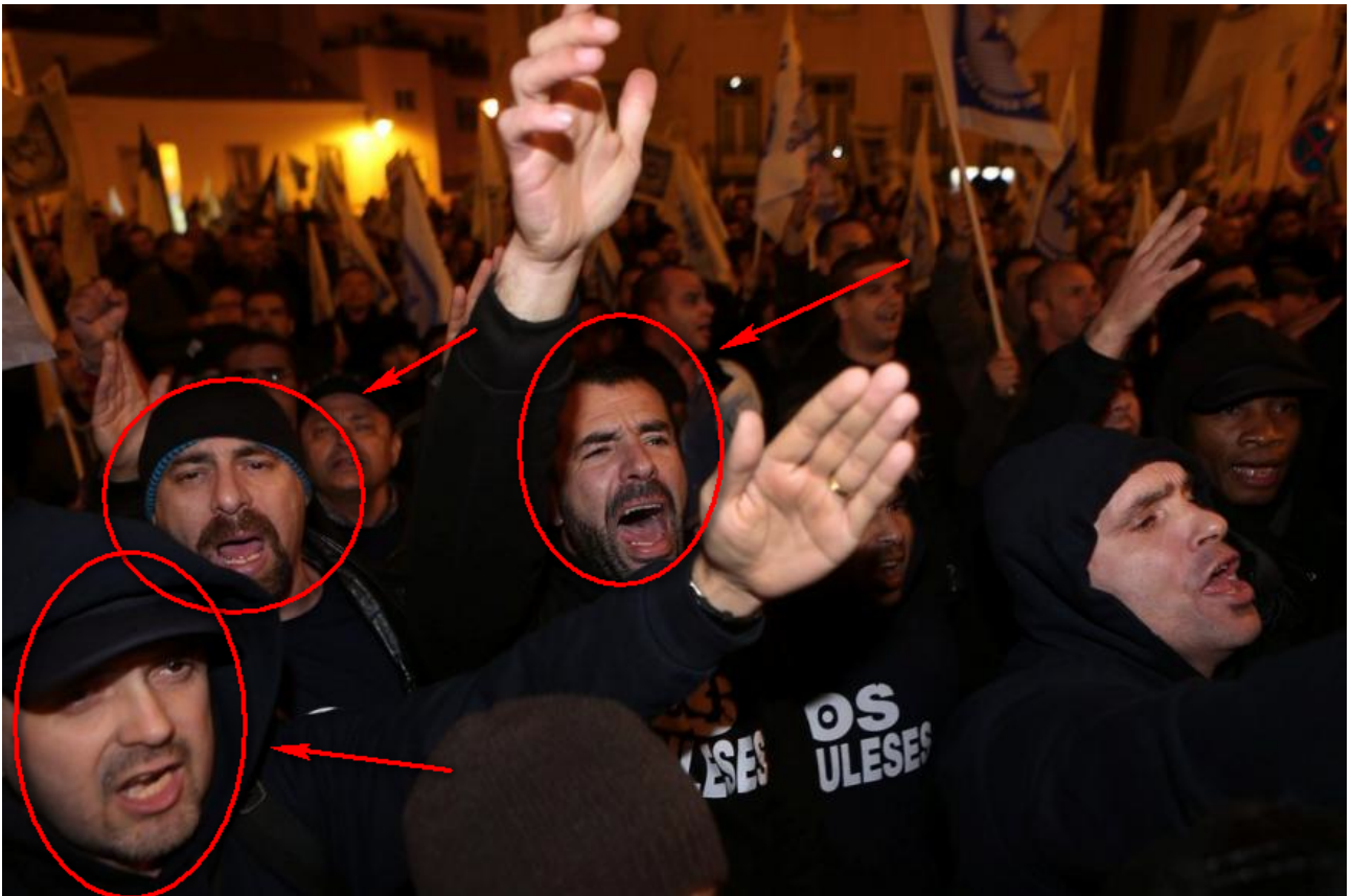
Figura 3 – Expressões em análise (1)