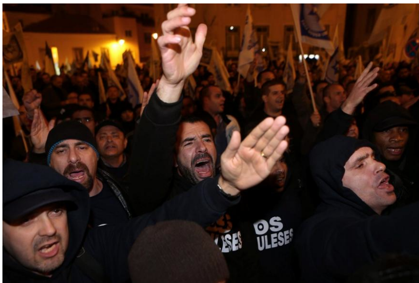
Figura 1 - Manifestação dos policiais na Assembleia da República (1) ( http://www.tvi24.iol.pt/fotos/sociedade/1/339443 )

A pesquisa qualitativa nunca estuda muitos casos, pois, e como já referimos, não visa uma análise probabilística. Neste estudo, foi escolhida a amostragem por caso único que consiste na escolha de uma situação/acontecimento. Este caso serve o propósito de uma investigação exploratória, abrindo pistas para futuras análises de generalização e exploração (Lessard-Hébert et al, 1997).