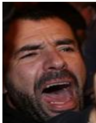
Figura 7 - Indivíduo 3