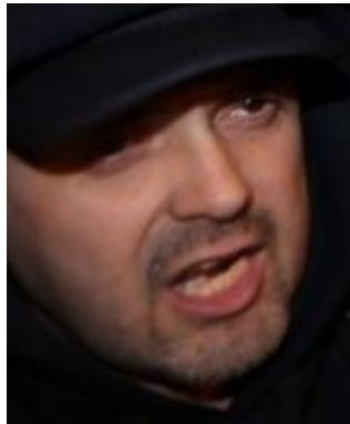
Figura 5 - Indivíduo 1

Assim, designaremos os indivíduos da seguinte forma. Na Figura 3, analisando a imagem da esquerda para a direita, o Indivíduo 1 (I1), o Indivíduo 2 (I2), o Indivíduo 3 (I3). Na Figura 4, o Indivíduo 4 (I4).