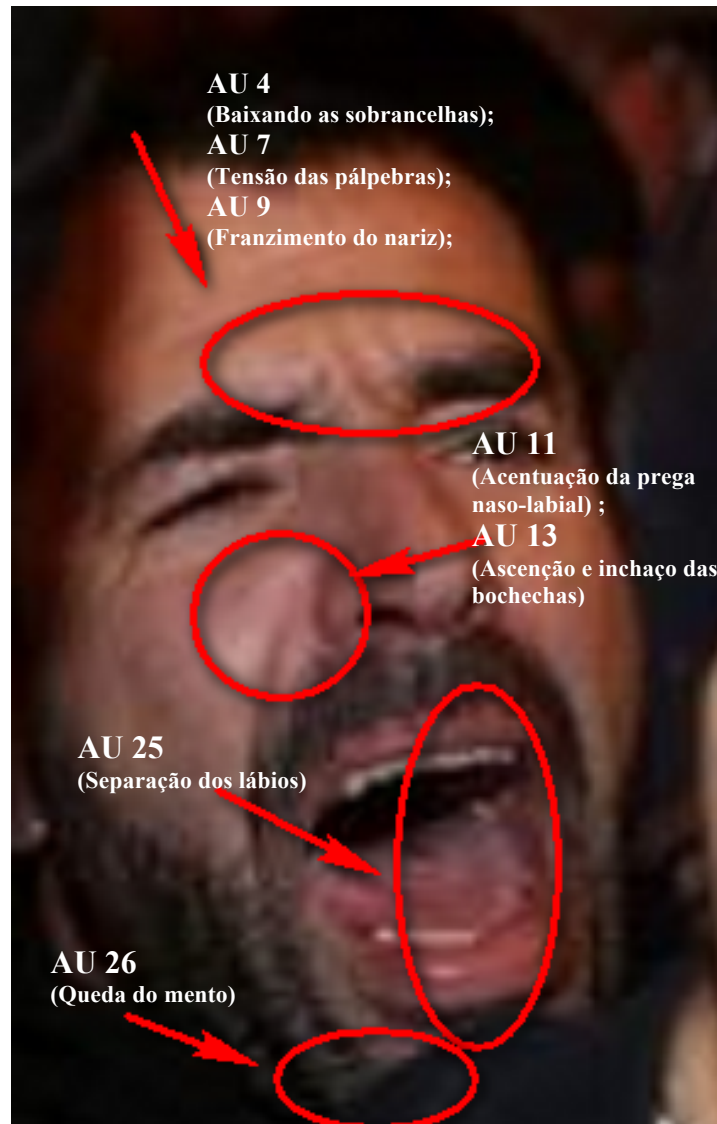
Figura 11 - Indivíduo 3, análise da expressão facial