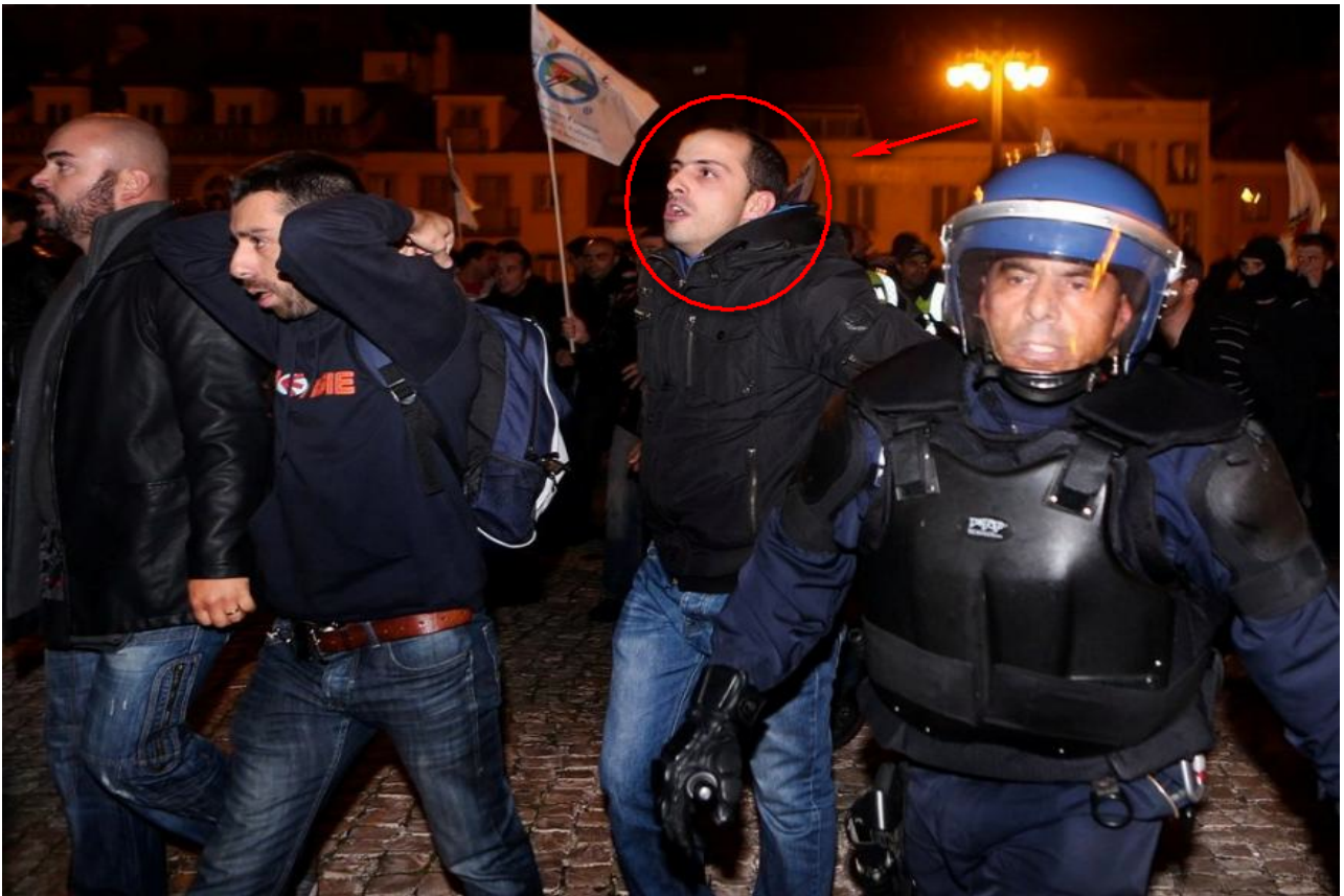
Figura 4 – Expressões em análise (2)