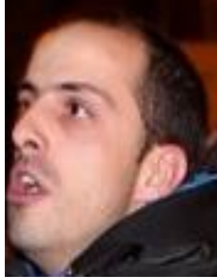
Figura 8 - Indivíduo 4