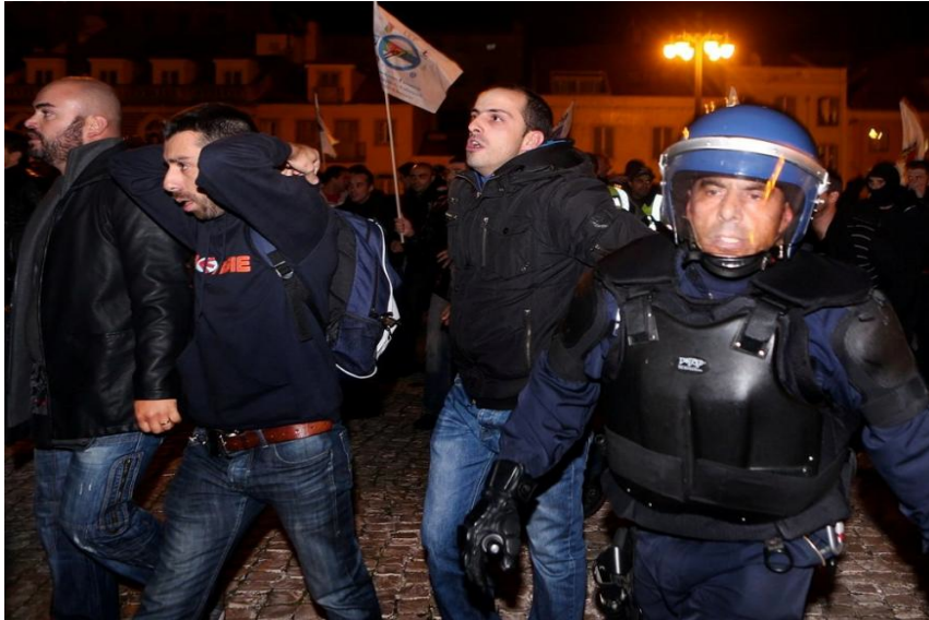
Figura 2 - Manifestação dos polícias na Assembleia da República (2) ( http://www.tvi24.iol.pt/fotos/sociedade/1/339443 )