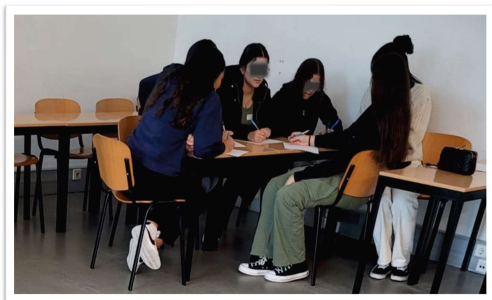
Figura 7: Espaço de entretenimento para adolescentes