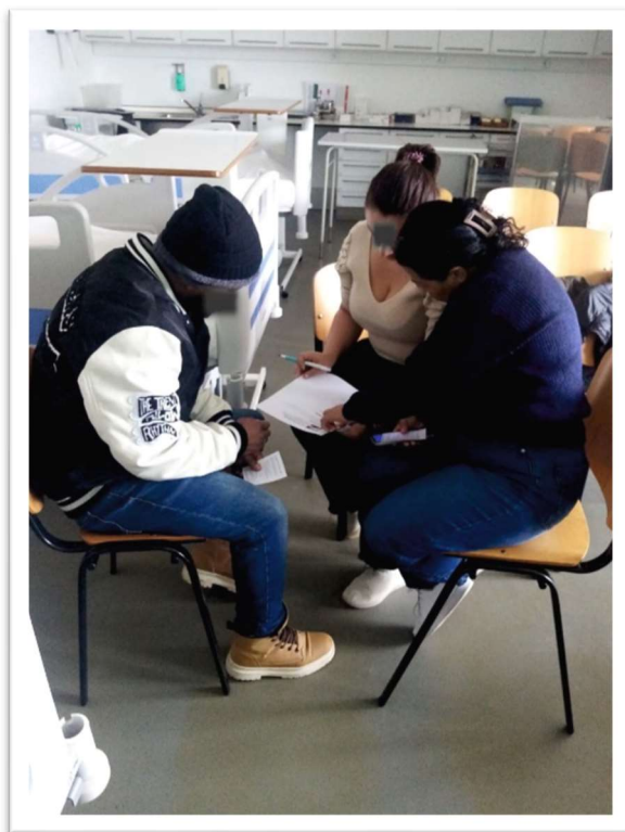
Figura 3: Aula sobre como preparar um curriculum

Com foco na necessidade de inserção dos migrantes no mercado de trabalho de Portugal, especialistas na área de recursos humanos (convidadas pela Cáritas) ensinaram os presentes a preparar um bom curriculum. Outros Professores da área de saúde (também convidados) ensinaram noções básicas dos primeiros socorros aos migrantes com filhos. E durante as palestras estiveram presentes enfermeiros voluntários a avaliar o estado de saúde de cada criança.