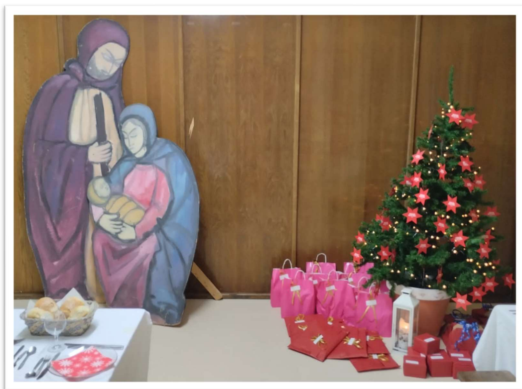
Figura 16: Prendas para os participantes