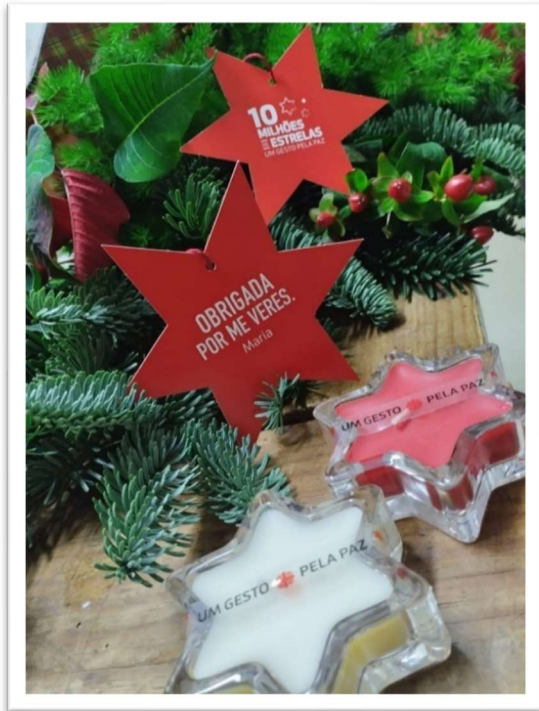
Figura 14: Ambiente Natalino