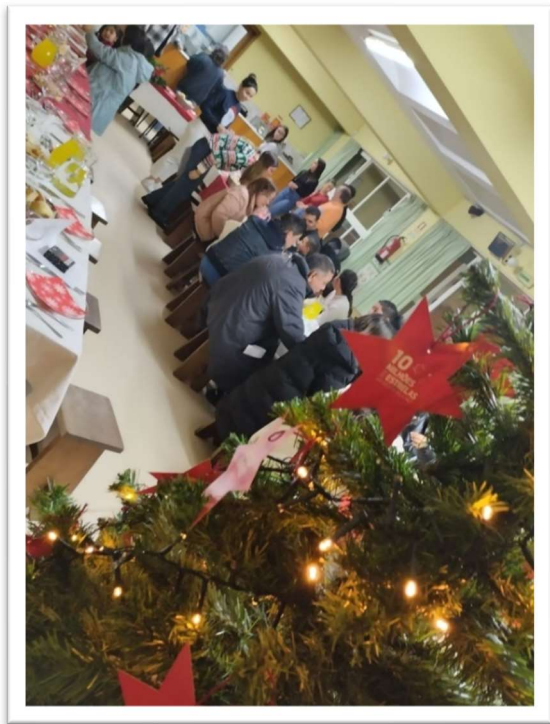
Figura 11: Jantar de Natal