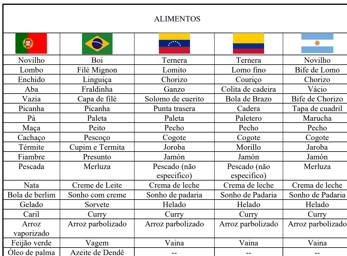
Tabela 1: Lista de alimentos/ nomes de acordo com os países

A possibilidade de conhecer os nomes dos alimentos em Portugal, relacionando-os com os alimentos já conhecidos na Argentina, no Brasil e noutros países da América Latina, fez com que os migrantes se animassem em experimentar suas receitas típicas em terras lusitanas. Com isso, esperávamos que a alimentação daquelas famílias pudesse melhorar em termos de qualidade, quantidade e frequência.