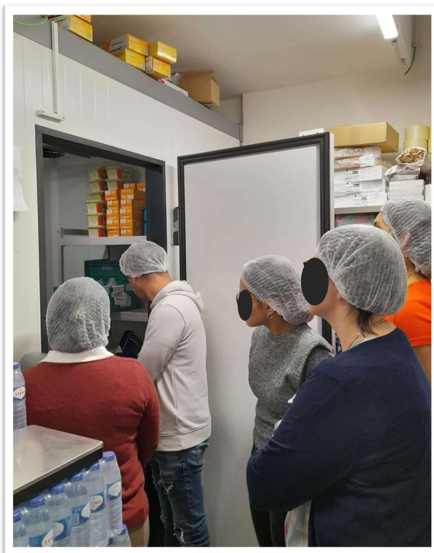
Figura 10: Aula sobre armazenamento de produtos alimentícios