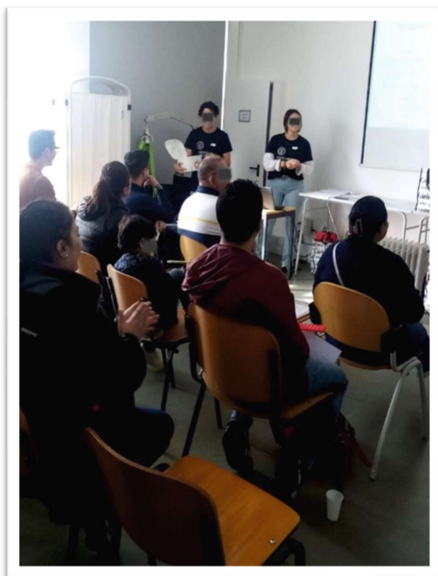
Figura 4: Aula sobre primeiros socorros