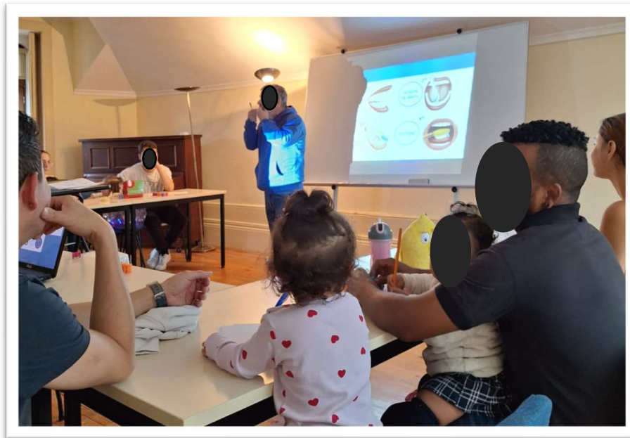
Figura 1: Palestra sobre saúde oral

Nessa primeira atividade chamada de Ação de Rastreamento Oral, Segurança Alimentar e Nutrição, dentistas e enfermeiros realizaram os rastreios orais e as palestras sobre saúde e bem estar. Em paralelo, os outros voluntários e os estagiários observavam o comportamento e atitudes dos migrantes presentes, conversavam com os mesmos e anotavam sobre suas experiências pessoais em Portugal. Além disso, ofereciam apoio às crianças, enquanto os pais focavam a atenção nos conteúdos ministrados.