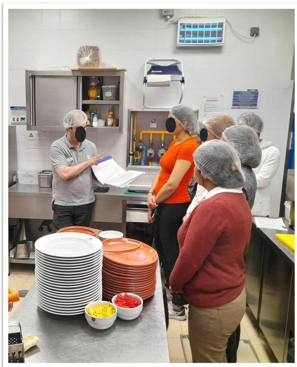
Figura 9: Aula sobre a confecção de pasteis de nata

A ação foi realizada num único dia. Os empresários da área da restauração na cidade do Porto (proprietários das empresas visitadas), ensinaram sobre o processo de produção de alimentos, com base na metodologia utilizada por eles, além de instruir os presentes sobre regras de atendimento àquele público específico.