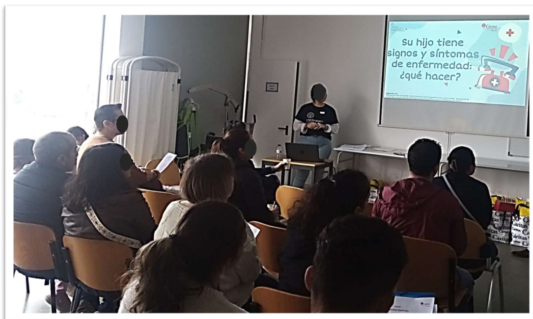
Figura 5: Aula 2 sobre primeiros socorros