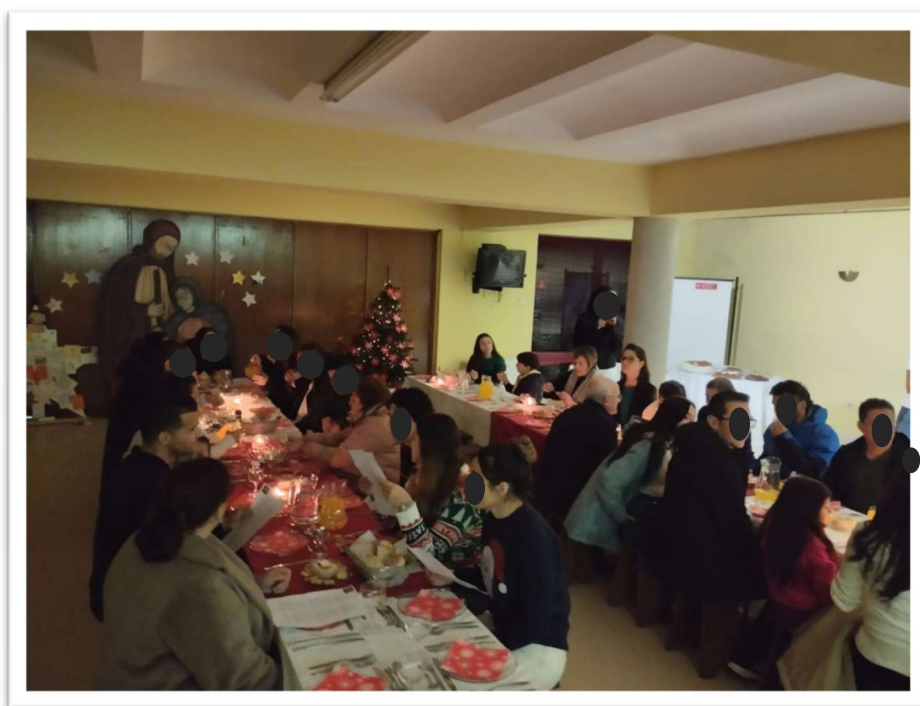
Figura 13: Convívio