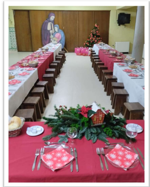
Figura 15: Mesa preparada para os convidados