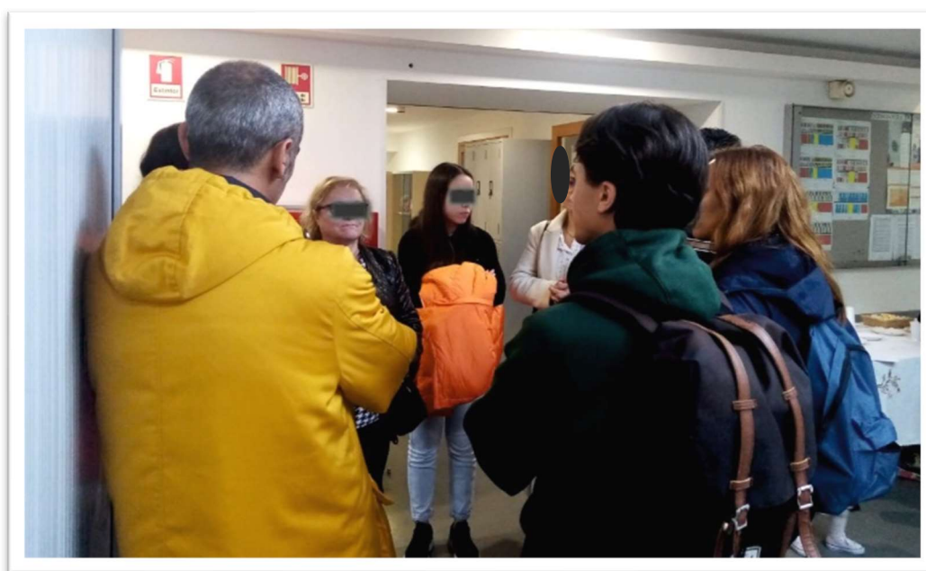
Figura 8: Intervalo entre as palestras/ convívio

Nesse dia foi possível verificar maior integração entre os participantes do projeto. Já havia trocas de contatos e de experiências. Estava bem visível a formação de laços de amizade e cooperação diante dos desafios comuns que todos enfrentavam como migrantes em Portugal. Este momento parecia cumprir a finalidade apontada de verificação da saúde para eventuais encaminhamentos, mas também cumpriu a finalidade de aproximar os participantes. Além das palestras, puderam contar com prendas e auxílio alimentar.