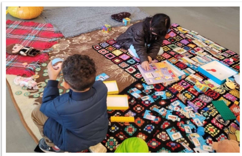
Figura 6: Espaço de entretenimento infantil

De modo a aplicar os conhecimentos adquiridos no Mestrado de Ação Humanitária, aproveitávamos momentos privados, em meio à ação coletiva, para conversar com as famílias e anotar seus anseios, dúvidas e expectativas. Também ficávamos com as crianças e com os adolescentes, num sítio afastado (espaço de entretenimento), enquanto os adultos aproveitavam o que lhes estava sendo ofertado a título de conhecimentos gerais para a vida profissional.