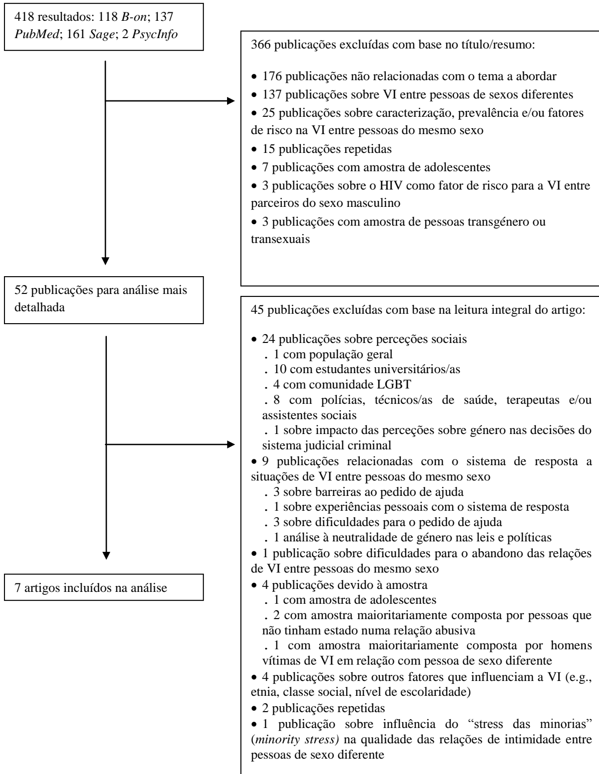
Figura 1 Fluxograma