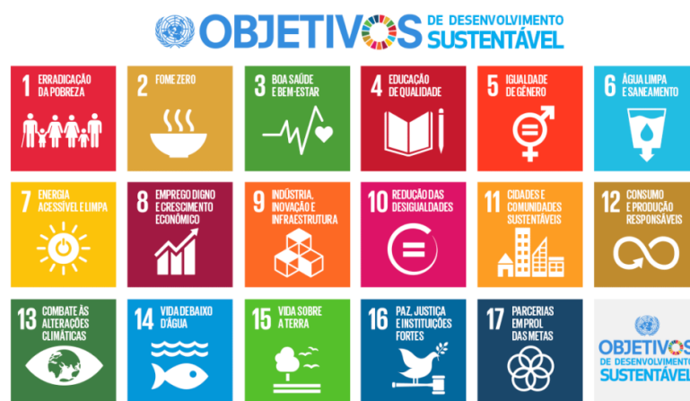
Figura 1. 17 Objetivos do Desenvolvimento Sustentável da ONU.

Os 17 ODS (Figura 1), juntamente elencados com as 169 metas dispersas sobre os mesmos, demonstram uma ambição desta nova agenda universal, a qual visa estabelecer e assegurar os direitos humanos e demais direitos essenciais a nível global. Na Tabela 1 apresenta-se uma breve descrição das metas presentes em cada um dos objetivos.