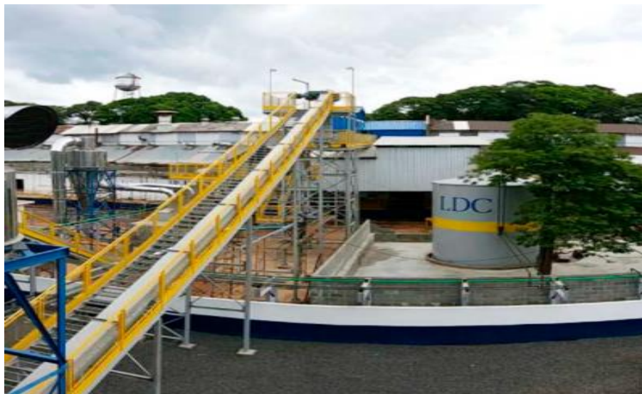
Figura 14. Terminal de Transbordo de Cargas – Santarém Pará.

No corredor norte Pará, a companhia possui um transbordo de carga e atua com uma frota fluvial, onde recebe, armazena e escoar grãos para todo o território mundial. A empresa trabalha em cima de um propósito de que, como uma comercializadora global do setor agrícola, esteja sempre contribuindo para o esforço global de prover sustento à população crescente, trabalhando sempre em prol de criar um valor justo e sustentável para o benefício das atuais e futuras gerações.