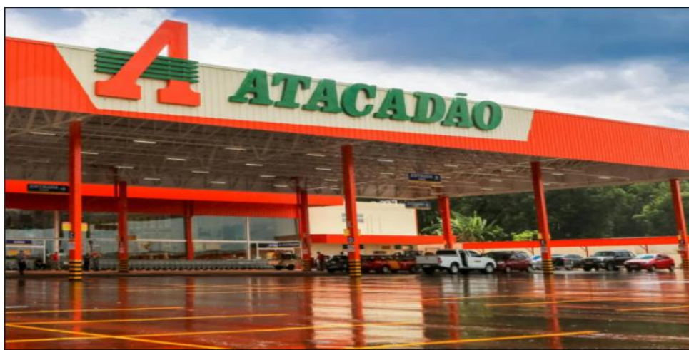
Figura 8. Rede Atacadão Santarém – PA.

Ocupando uma posição de destaque no cenário nacional, o Atacadão é a maior rede de supermercados atacadistas do Brasil e está entre as maiores empresas do segmento do país. Possui uma rede com cerca de 193 lojas de autosserviço e 29 atacados de distribuição em todo o território nacional. Emprega cerca de 50 mil funcionários e atua em atividades comerciais fundamentais, oferecendo ao seu público-alvo uma variada gama de produtos, desde alimentos em geral a linhas de limpeza, bazar, dentre outros.