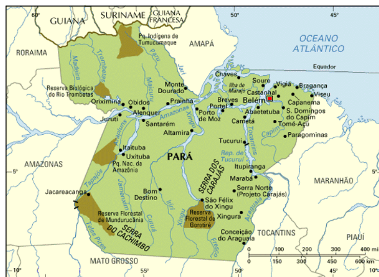
Figura 3. Mapa do Estado do Pará

Localizado no Norte do Brasil, o Estado do Pará possui a maior extensão territorial, com uma área de aproximadamente 1.245.870,707 km 2 , possui clima equatorial característica da região Amazônica, e é considerada a 27 unidade federativa do Brasil (IBGE, 2020)