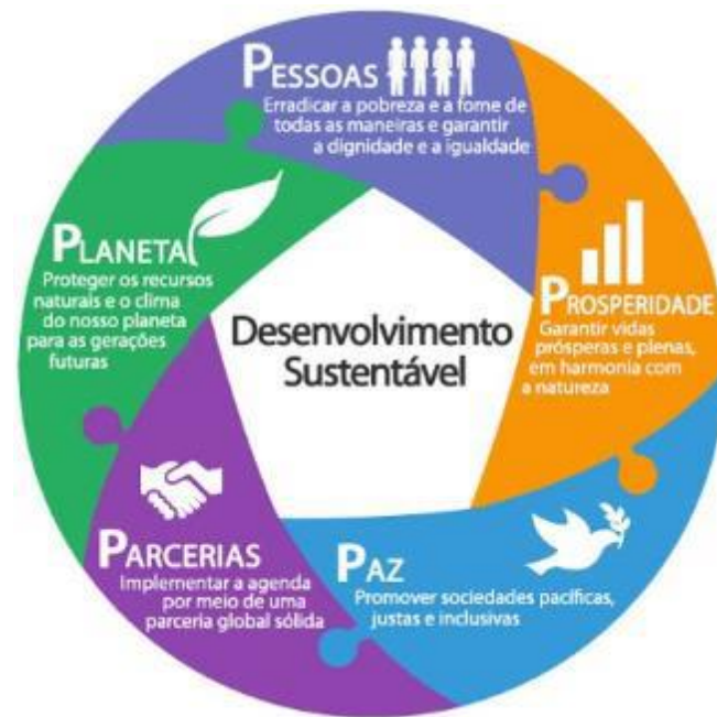
Figura 2. Desenvolvimento Sustentável – 5 P’s