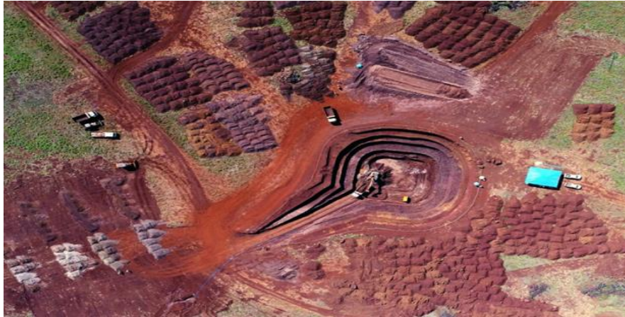
Figura 12. Instalações projeto Araguaia- Canã dos Carajás – PA. Horizonte Minerals