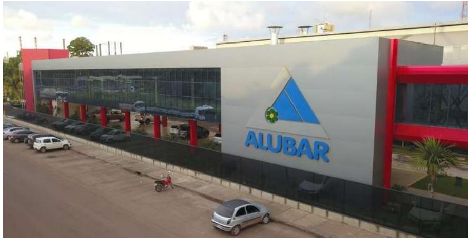
Figura 6. Sede Alubar- Barcarena -PA