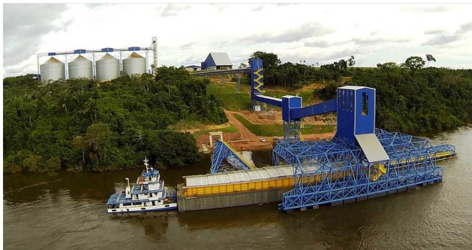
Figura 7. UNITAPAJÓS – Porto de transbordo/ Miritituba – PA