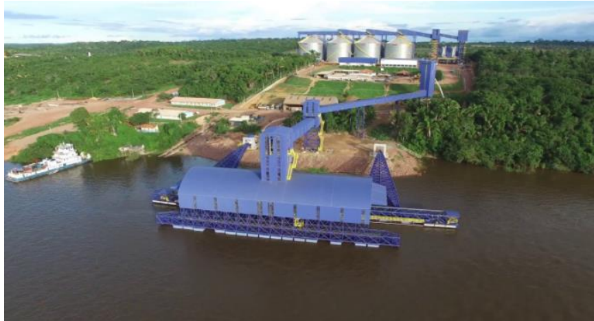
Figura 11. Terminal de Transbordo de Carga Hidrovias do Brasil Itaituba-PA

Fonte: Infomoney. Disponível em: < https://www.infomoney.com.br/cotacoes/hidrovias-do-brasil-hbsa3 >.