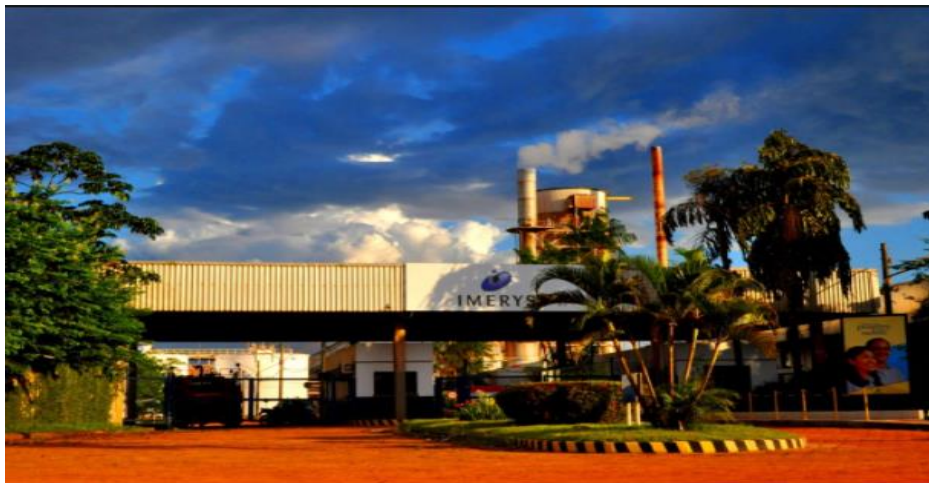
Figura 18. Ymeris

A Ymeris é uma empresa multinacional francesa, especializada na produção de processamento de minerais industriais, fundada em 1880, com sede em Paris. A empresa possui operações em mais de 50 países, com cerca de 250 instalações industriais e emprega cerca de 16.000 funcionários. No Brasil, a mesma possui sede em vários estados, sendo que no estado do Pará a empresa está situada no município de Barcarena - desde 1971 - tendo como principal atividade o beneficiamento de gesso e Caulim associado à extração.