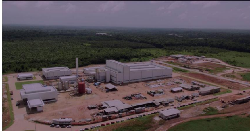
Figura 16. Fábrica Natura em Benevides.

um todo, gerando resultados integrados nas dimensões econômica, social e ambiental. A empresa acredita que resultados sustentáveis são aqueles alcançados por meio de relações de qualidade e, por isso, busca manter canais de diálogo aberto com todos os públicos com que tem contato, trabalhando assim com transparência.