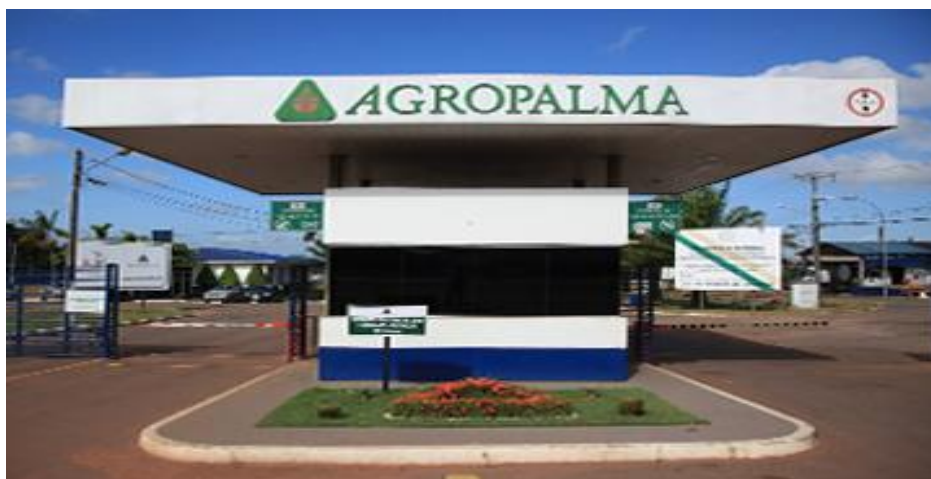
Figura 4. Agropalma – Refinaria Belém - PA

A Agropalma é uma empresa que produz óleos, gorduras e derivados do óleo de palma, sendo a maior produtora de óleo de dendê da América Latina. Está no Brasil desde 1982, no estado do Pará. Possui cerca de mais de 160 funcionários, e trabalha com a missão de produzir e comercializar no mercado nacional e internacional, óleo vegetal e seus derivados, garantindo o Desenvolvimento Sustentável do negócio, gerando riquezas e atendendo aos requisitos de todas as partes interessadas.