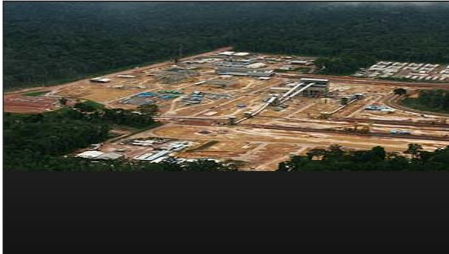
Figura 5. Mina Exploratória Alcoa Juruti- Pará

de bauxita do município. O propósito da Alcoa é de sempre trabalhar em prol de operações de excelência e de segurança operacional, performance financeira, impacto social e proteção ambiental, sempre empenhando-se em um futuro melhor para a comunidade na qual atua.