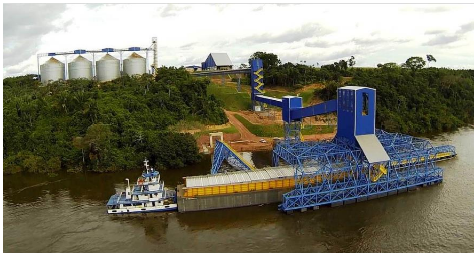
Figura 9. UNITAPAJÓS – Porto de transbordo/ Miritituba - PA

A empresa trabalha com o compromisso de contribuir continuamente com o Desenvolvimento Sustentável, na oferta de alimentos e demais segmentos, aprimorando assim a sua cadeia global no agronegócio.