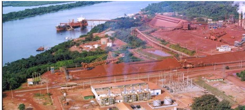
Figura 15. Terminal Mineração Rio do Norte Porto Trombetas -Pará.

A Mineração Rio do Norte é uma das maiores mineradoras do Brasil e maior produtora de bauxita, matéria-prima do alumínio. Uma companhia constituída por uma associação de empresas nacionais e estrangeiras, que desde 1979 tem suas operações dentro da Amazônia do Brasil, especificamente no rio Trombetas no Pará. Emprega cerca de 300 funcionários e trabalha com o compromisso de gerar desenvolvimento econômico com respeito à natureza e à vida.