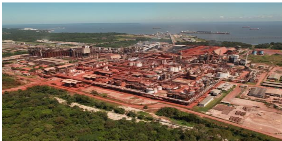
Figura 13. Hydro Alunorte – Barcarena - PA

A Alunorte é a maior refinaria de alumina do mundo fora da China e está localizada na cidade de Barcarena, no estado do Pará. É uma empresa norueguesa de alumínio e energia renovável, com sede em Oslo. É uma das maiores empresas de alumínio do mundo. Tem operações em cerca de 50 países em todo o mundo e está ativo em todos os continentes. A empresa já possui sedes nas capitais de Rio de Janeiro e São Paulo (sudeste brasileiro); no Pará a empresa emprega cerca de 1500 trabalhadores. Sua missão é atuar criando uma sociedade mais viável, ao desenvolver recursos naturais em produtos e soluções, de forma inovadora e eficiente.