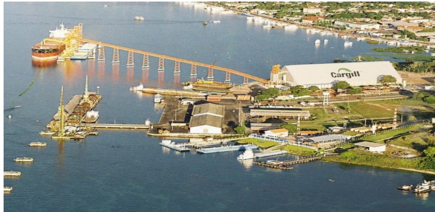
Figura 10. Terminal Fluvial da Cargill em Santarém – PA

O compromisso da Cargill está voltado a nutrir o mundo de forma segura e sustentável, reunindo pessoas, ideias e recursos para entregar produtos, tecnologia e formas de operar que construam negócios de sucesso e comunidades enriquecidas. No Brasil, a empresa está dividida em 17 estados, com 23 fábricas e 6 terminais portuários e emprega cerca de 10 mil funcionários. No estado do Pará, a mesma tem sede matriz em Santarém- PA e Miritituba -PA, sendo dois dos principais terminais de recebimento e escoamento de Grãos.