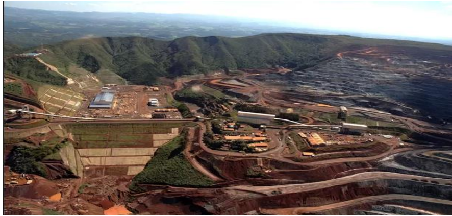
Figura 17. Mina do S11D- Canaã dos Carajás - PA