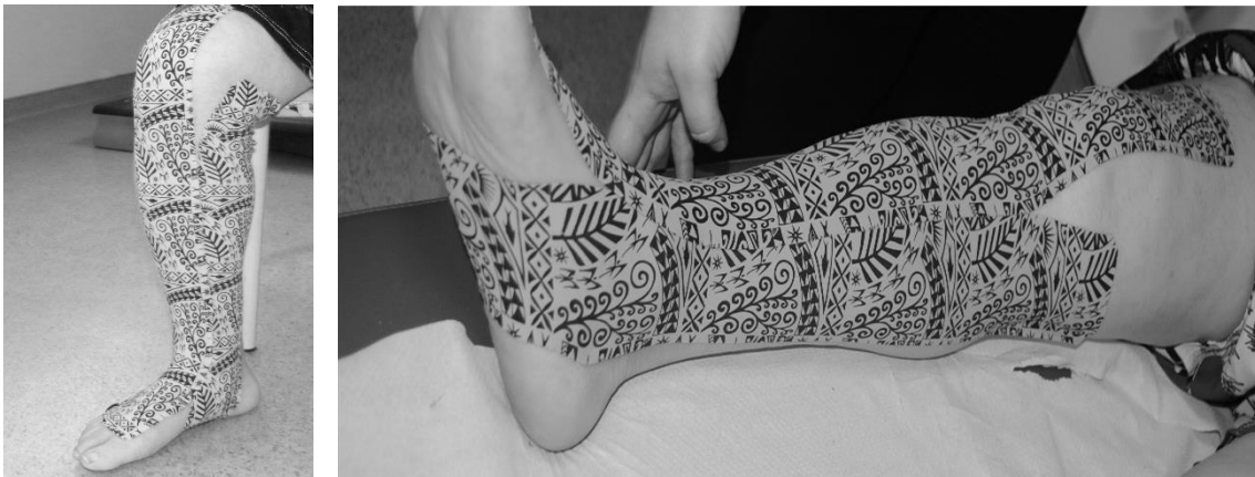
Figura 1 – Resultado final da aplicação do Dynamic Tape

(7,5x5) foi posicionado no músculo tibial anterior de modo a facilitar biomecânicamente o movimento de dorsiflexão e no quadríceps (reto anterior) de modo a controlar a flexão do joelho de forma excêntrica. Para colocar este tape a tibio-társica foi posicionada em máximo encurtamento de dorsiflexão e o joelho em flexão. O segundo tape (7,5x5) foi colocado segundo a técnica de suporte dos músculos inversores do pé, no músculo tibial anterior, de modo a controlar este movimento excentricamente. Para colocação deste tape a tibio-társica foi posicionada em máximo encurtamento do movimento de inversão. Em ambas as colocações, fixaram-se as âncoras com cerca de 5 cm e sem tensão e a zona terapêutica com aplicação de tensão na posição de encurtamento do movimento pretendido.