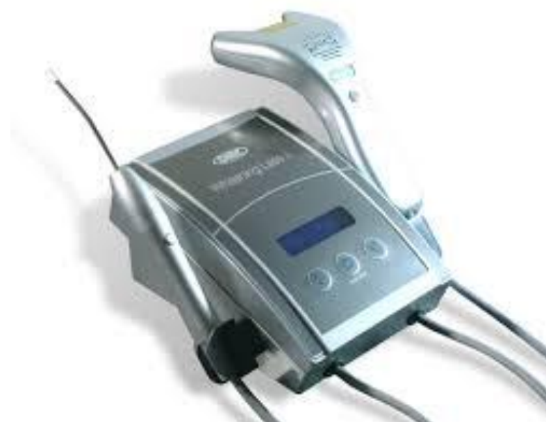
Figura 4 - Modelo de Laser.