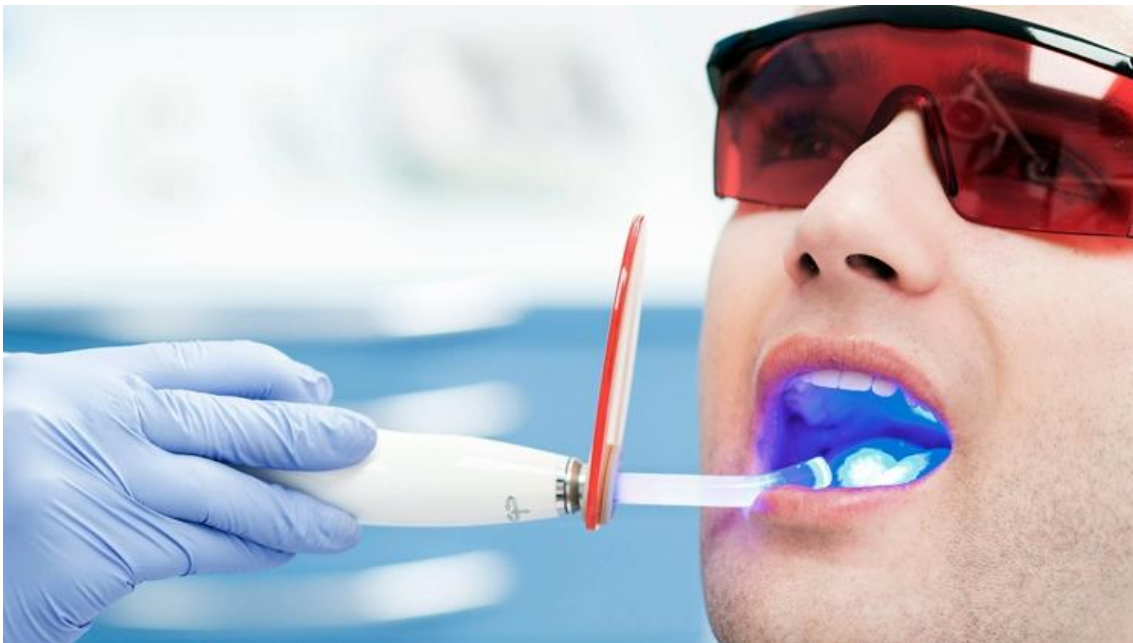
Figura 7 - Modelos do uso de LED.

< http://www.wdental.com.br/fotopolimerizador-led-single-essence-dental-vh.html > e