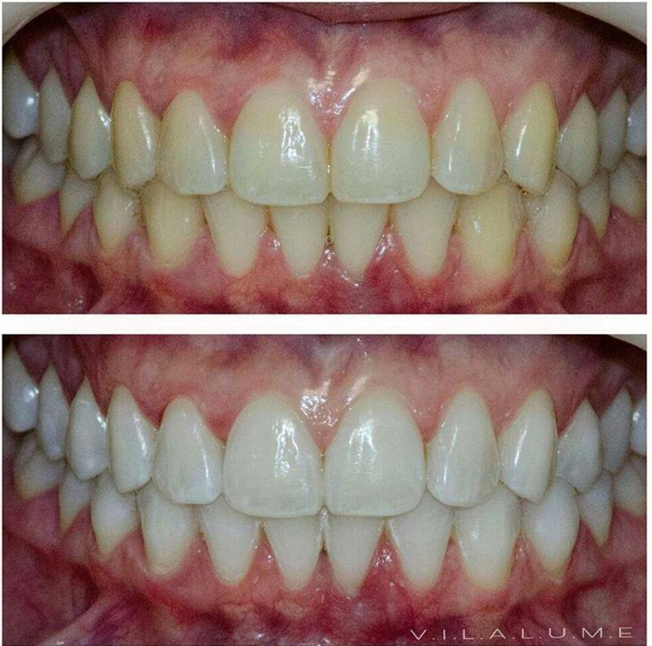
Figura 6 - Modelos de dentes com Branqueamento a Laser. < https://mulpix.com/instagram/clareamento_a_laser_realizado.html >