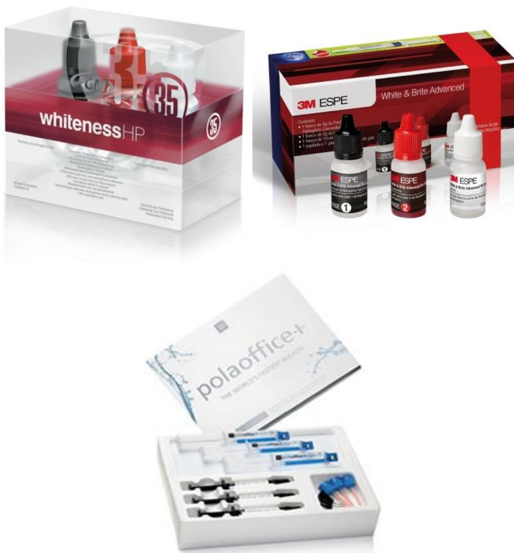
Figura 2 - Modelos de marcas comerciais de Peróxido de Hidrogênio 35%.

sessão. Alguns meses depois pode haver recidiva para a cor original (Marson et al. , 2006).