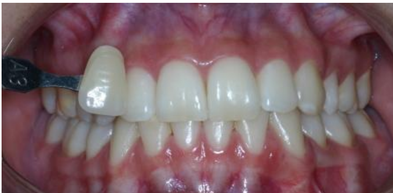
Antes: Pequenas manchas escuras nas incisais dos centrais, cor A3