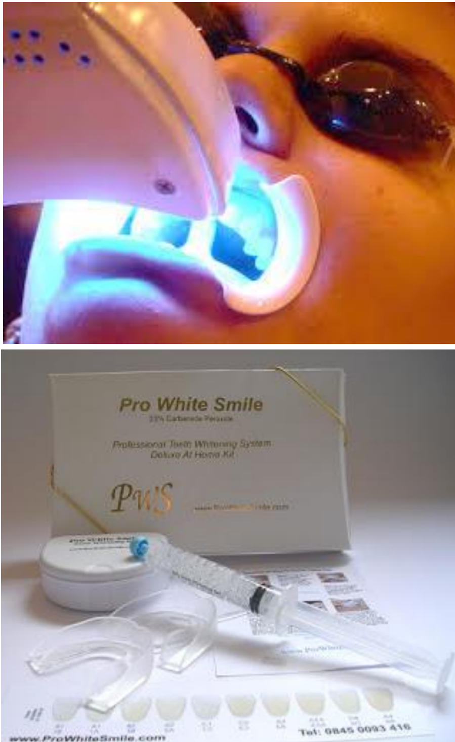
Figura 8 – Modelos de Branqueamento Combinado.

< http://www.google.pt/search?q=branqueamento+combinado >