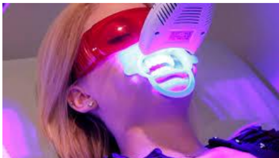
Figura 5 - Modelo da técnica do uso do Laser.

http://implorthocenter.com.br/clareamento-dental-laser/