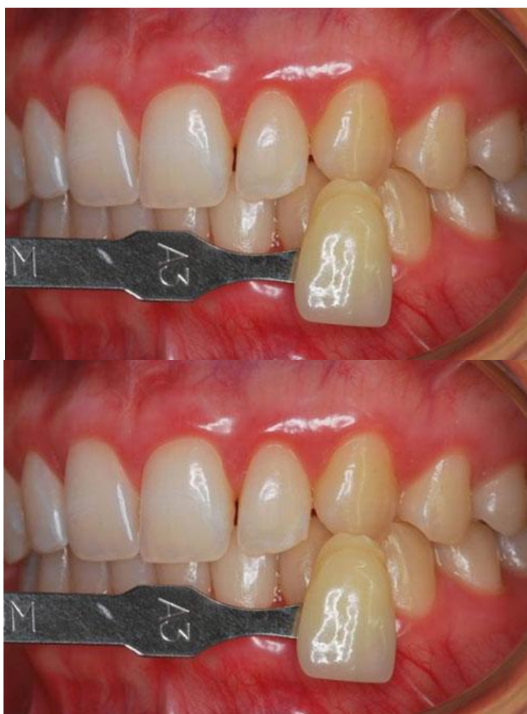
Figura 10 – Modelos de Casos Clínicos Antes e Depois do Branqueamento