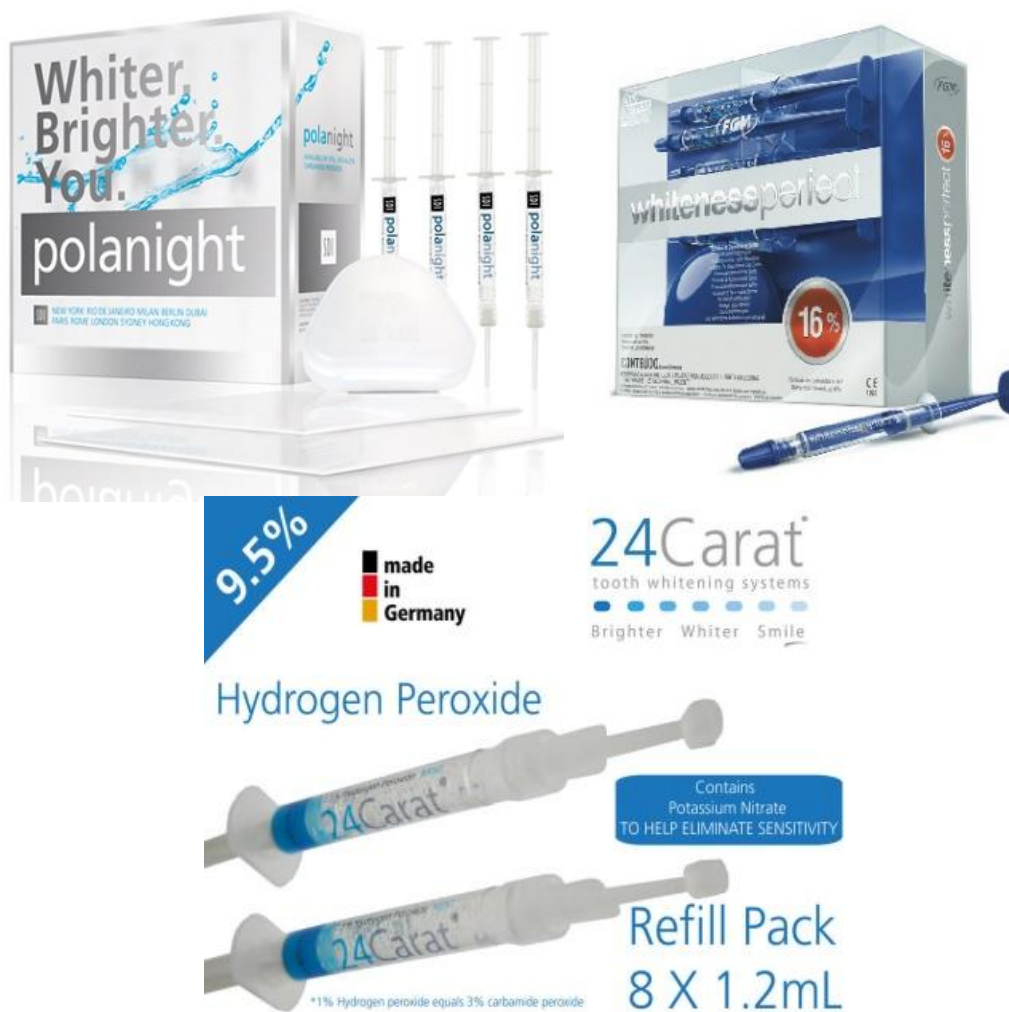
Figura 1 - Modelos de marcas comerciais de Peróxido de Carbamida.

A grande vantagem do peróxido de carbamida é que não precisa da presença de calor e nem condicionamento ácido para atuar (Francci et al. , 2010).