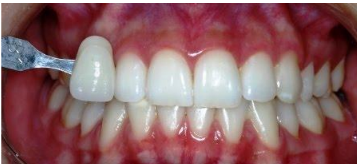
Depois de 6 meses: Clareamento obtido cor B1 e uniformização de cores