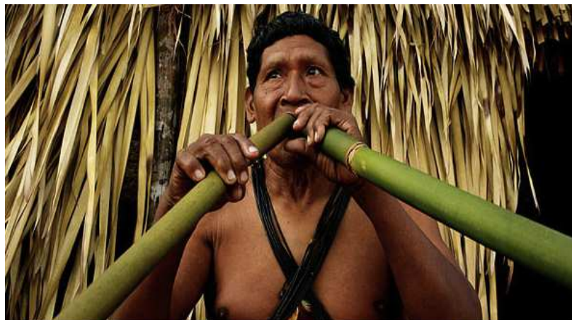
Fig. 15 – Índios Cinta Larga.

últimos anos vem sendo profundamente abalado pela incidência de garimpeiros em suas terras.