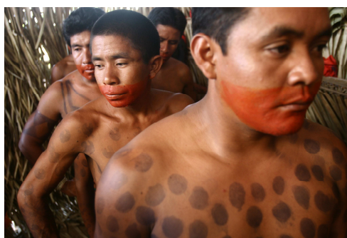
Fig. 7. — Índios Guajajara