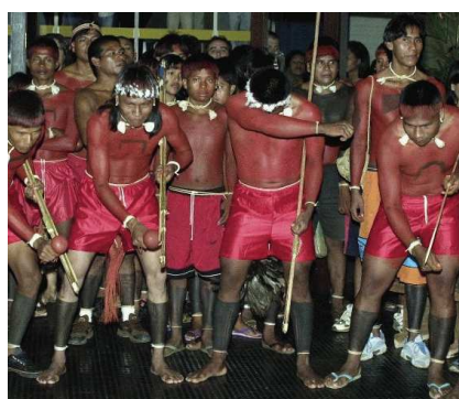
Fig. 8. — Índios Xavante