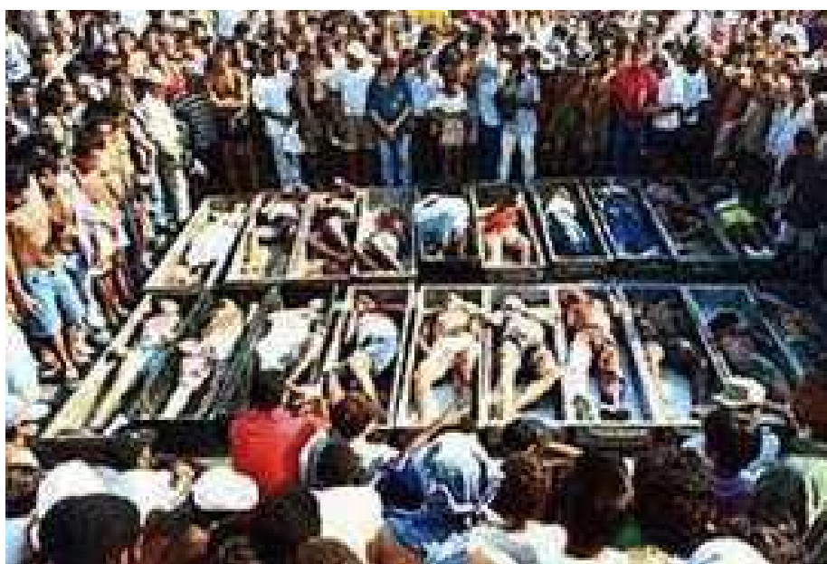
Fig. 16 – Massacre dos Garimpeiros na Reserva Roosevelt

por jazidas de diamantes. Os autores dos atos foram pessoas pertencentes à etnia dos Índios Cinta Larga. Não foi aberto qualquer processo criminal em seguimento destes factos. Foram detidos, em seguimento de investigações por homicídio, 23 pessoas de etnia índia “Cinta-Larga”. Contudo, o processo foi seguidamente arquivado, por falta de provas.