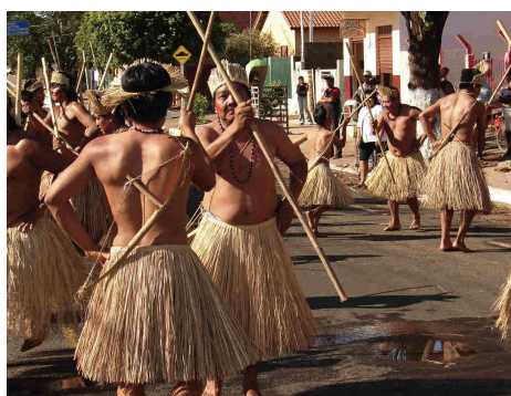
Fig. 6. — Índios Terena

Os terenas são um grupo indígena brasileiro, composto por cerca de 16.000 índios e que possuem a cultura do plantio e apresentam um grande grau de integração com a sociedade circundante. Vivem principalmente no estado de Mato Grosso do Sul (Áreas Indígenas Aldeinha, Buriti, Dourados, Lalima, Limão Verde, Nioaque, PiladeRebuá, Taunay/Ipegue e Terras Indígenas Água Limpa e Cachoeirinha, a oeste da Reserva Indígena Kadiwéu, na Área Indígena Umutina e a leste do rio Miranda). Podem ser encontrados também no interior do Estado brasileiro de São Paulo (Áreas Indígenas Araribá e Icatu). Além disso, situam-se ainda na margem esquerda do alto rio Paraguai, em Mato Grosso e no norte deste Estado.