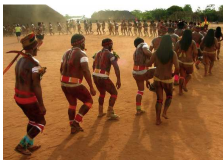
Fig. 3. — Índios Guarani.

Com cerca de 30.000 índios, os guaranis são uma das etnias mais documentadas de todos os tempos e uma das mais representativas etnias indígenas das Américas. Seus territórios tradicionais ocupam uma ampla região da América do Sul que abrange Bolívia, Paraguai, Argentina, Uruguai e a porção centro-meridional do território brasileiro. São chamados povos (no plural) pois sua ampla população encontra-se dividida em diversos subgrupos étnicos e cada um possui especificidades dialetais, culturais e cosmológicas, diferenciando assim sua forma de ser guarani das demais.