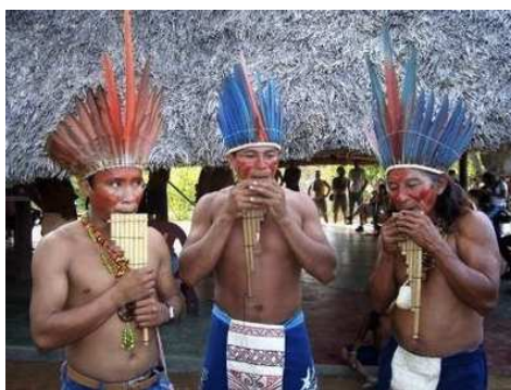
Fig. 5. — Índios Macuxi