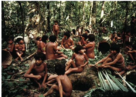
Fig. 9. — Índios Ianomâmi

Os Ianomâmis são índios que habitam o Brasil e a Venezuela. No Brasil são cerca de 12.000 índios e as aldeias ianomâmis ocupam a grande região montanhosa da fronteira com a Venezuela, numa área contínua de 9.419.108 hectares. Uma grande invasão garimpeira do território ianomâmi se deu no período de 1987 a 1992 em que estima-se a ocorrência de 1.500 mortes entre aquela população indígena. A Terra indígena ianomâmi foi homologada pelo presidente Fernando Collor em 25 de maio de 1992.