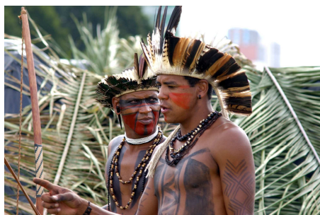
Fig. 10. — Índios Pataxó