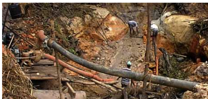
Fig. 17– Sítio na Reserva Roosevelt

A atuação do Estado brasileiro foi declinando a partir do ponto culminante havido em 2004, a medida em que a questão Cinta Larga foi desaparecendo dos jornais dentro e fora do País, o interesse do Governo pelo tema minava em igual ou maior proporção. A medida em que as mortes foram sendo menos noticiadas, o Governo mais se distanciava dos índios. Atualmente, não se tem notícias de incidentes fatais envolvendo índios e garimpeiros. Todavia, o esforço governamental para abrandar a catastrófica situação do povo Cinta Larga é mínimo, talvez inexistente. O tema está invisível aos olhos do atual Governo Federal e, por certo, desconhecido de muitos agentes encarregados diretamente de enfrentá-lo.