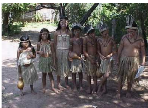
Fig. 4. — Índios Caingangue