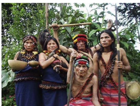
Fig. 11. — Índios Potiguara

Vários descendentes da tribo dos potiguares adotaram, ao serem submetidos ao batismo cristão, o sobrenome Camarão.