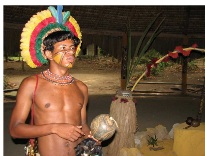
Fig. 2 — Índio Ticuna.